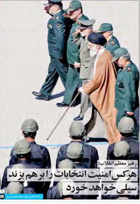
رهبر معظم انقلاب: هر کس امنیت انتخابات را برهم بزند سیلی خواهد خورد

۱۵۰ اقتصاددان بر جسته‌ها برای خطاب به ملت: