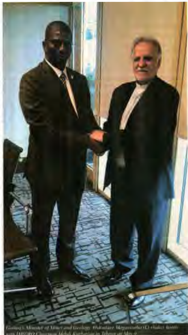
Guinea's Minister of Mines and Geology, Abdoulaye Magassouba (L) shakes hands with IMIDRO Chairman Mehdi Karbasian in Tehran on May 9.

Bauxite and alumina represent the first two links in the value chain on the way to aluminum production. Bauxite is the most common raw material used to produce alumina for aluminum metal production. The white powder, alumina, is produced by the refining of bauxite.