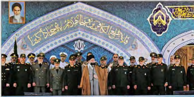
فرمانده کل قوا در دانشگاه امام حسین