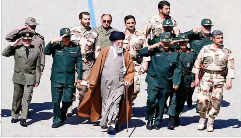
شهر و زد