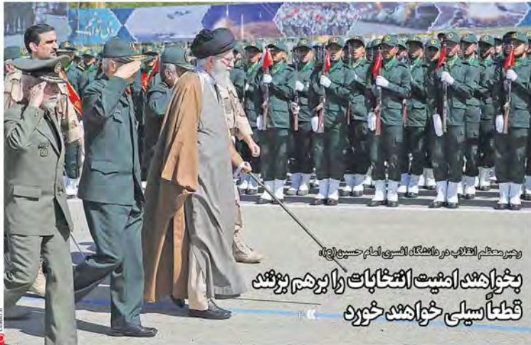
رهبر معظم انقلاب در ملاقاتگاه انجمن امام حسین (ع)

سال بیست و سوم شماره ۶۴۴ پنجشنبه ۲۱ اردیبهشت ۱۳۹۶ ۱۴ شعبان ۱۴۳۸ صفحه ۴۴ سایر استان‌ها ۲۰۰ تومان استان تهران و البرز ۵۰۰ تومان Thursday 11 May 2017 No. 6452 CODEN: IRANX Kishida: IRAN (Tehran) 003322727000