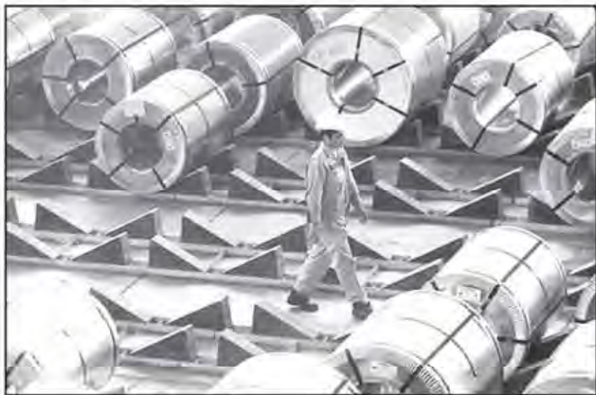
A worker walks by the rolls of steel sheet at MSC in this file photo. .

KSC exported 1.9 million tons of billet and slab in the Persian year which ended on March 20, posting a