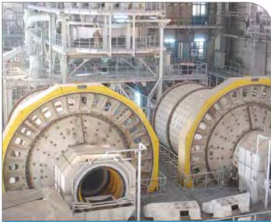
نگارخانه از صنایع فولاد

ارزش اقتصادی تایید شود سپس به دنبال تکمیل زنجیره برویم. این موضوع نیز برای تکمیل زنجیره ارزش در دستور کار قرار دارد. سه گفته پورمقدم، تهیه این پکیج برای نخستین بار در دولت یازدهم در راستای تکمیل زنجیره ارزش در حال اجراست که اشتغالزایی و تحقق حقوق دولتی را در بر می گیرد.