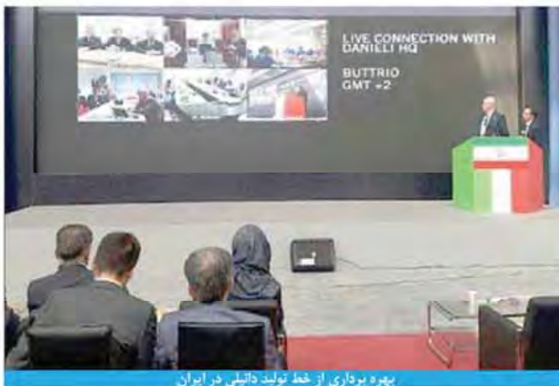
بهره برداری از خط تولید دانیلی در ایران

همچون نفلین سیتیت، طلا، زغال سنگ، سرب، روی و ... را داریم، او در ادامه افزود ان اف سی در حال سرعت دادن به طرح‌ها از جمله آلومینیوم جنوب و آلومینیوم جاجرم است. دولت چین با هدف کاهش مصرف انرژی در صنایع به ویژه صنعت آلومینیوم، مشوق‌هایی برقرار کرده که بر اساس آن ان اف سی طرح‌های خود را در ایران نیز با بهره‌گیری از فناوری‌هایی انجام می‌دهد که مصرف انرژی را کاهش می‌دهند.