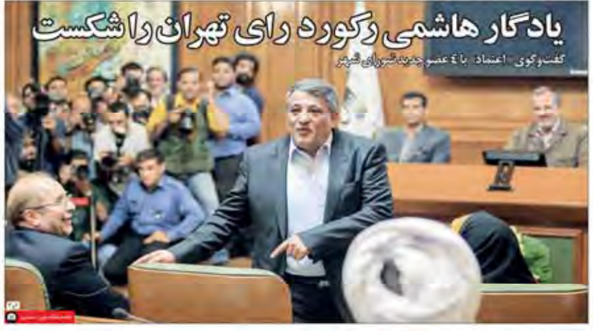
یادگار هاشمی رگورد رای تهران را شکست گفتگوی اعتماد با عضو حزب شیروانی شیر