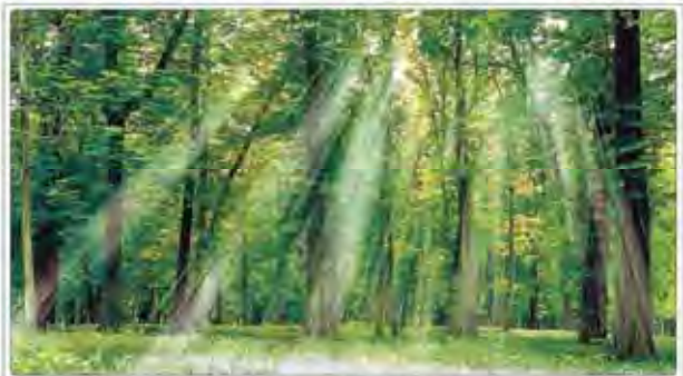
توقف بهره برداری از جنگل‌های شمال از سال آینده

مقامات ارشد کشورهای عضو سازمان همکاری شانگهای اعلام آمادگی کردند تا با دولت روحانی همکاری کنند. این اقدام در راستای تقویت همکاری‌های منطقه‌ای و اقتصادی است.