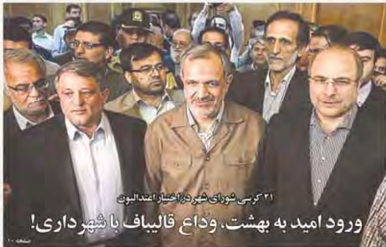
۲۱ کرسی شورای شهر دو اختیار اعتدالیون

ورود امید به بهشت، وداع قالیباف با شهرداری!