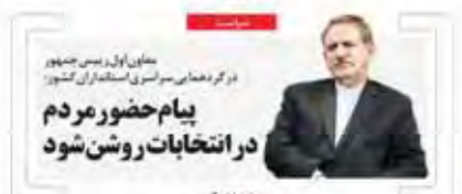
معاون اول رئیس جمهور در گردهمایی مورسری استکهولم کشور

شبهه ۲۲ سال قبل در چنین روزی، تهران شاهد افتتاح نخستین برج های مسکونی بود. این مجتمع ها در بهجت آباد و ساعی واقع شدند. در آن زمان، زندگی در این برج ها چالش های فراوانی داشت. نبودن امکانات رفاهی، کمبود خدمات و مشکلاتی که هنوز هم در مجتمع های مسکونی تهران وجود دارد. در آن زمان، مردم برای خرید این واحدها باید به خارج از شهر می رفتند و این امر برای بسیاری از آنها دشوار بود. همچنین، نبودن خدماتی مانند آب سرد، گاز و برق در این برج ها، زندگی را برای ساکنین بسیار دشوار می کرد. با وجود این مشکلات، این مجتمع ها به دلیل موقعیت استراتژیک و فضای سبز آنها، برای بسیاری از مردم تهران جذاب بود.