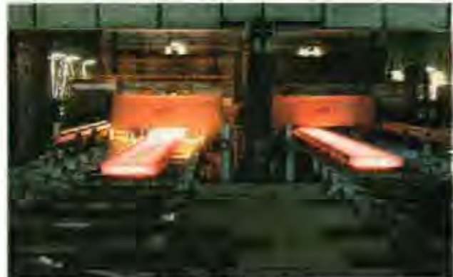
Semis had the largest share in Iran's steel exports in the fiscal 2016-17.