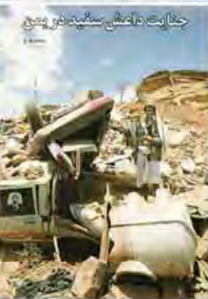
جنگابیت بدالت‌های ستیزانه شیعی