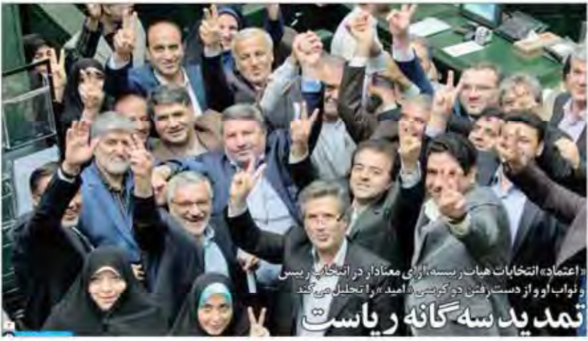
اعتماد انتخابات هیات ریسه، از بی معنادار در انتخابات ریسی و نواب او و از دست رفتن در گریبی، امید را تحلیل می کند تمدید سه گانه ریاست