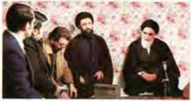
تصویر روح الله در قاب تلویزیون