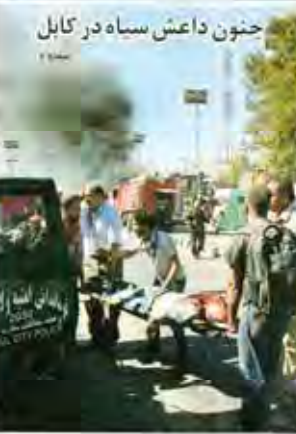
جنون داعش سیاه در کابل