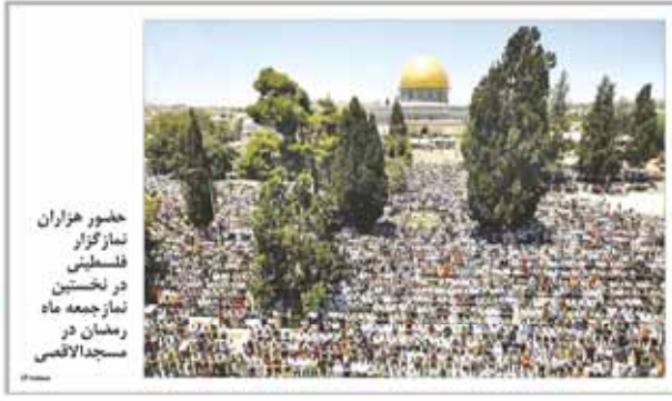
حضور هزاران نمازگزار فلسطینی در نخستین نماز جمعه ماه رمضان در مسجد الاقصی

دانشگاه سالیس در نیویورک اعلام کرد که این اقدام، یک جنایت جنگی است.