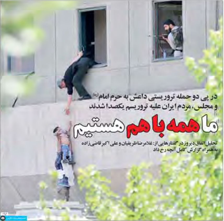
در پی دو حمله تروریستی داعش به حرم امام (ره) و مجلس، مردم ایران علیه تروریسم یکصدا شدند