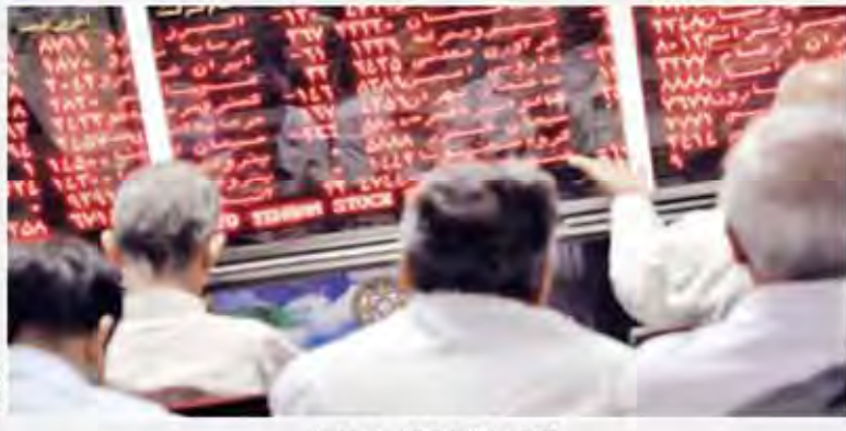
گزارش جهان اقتصاد از دلایل سردی بازار سهام