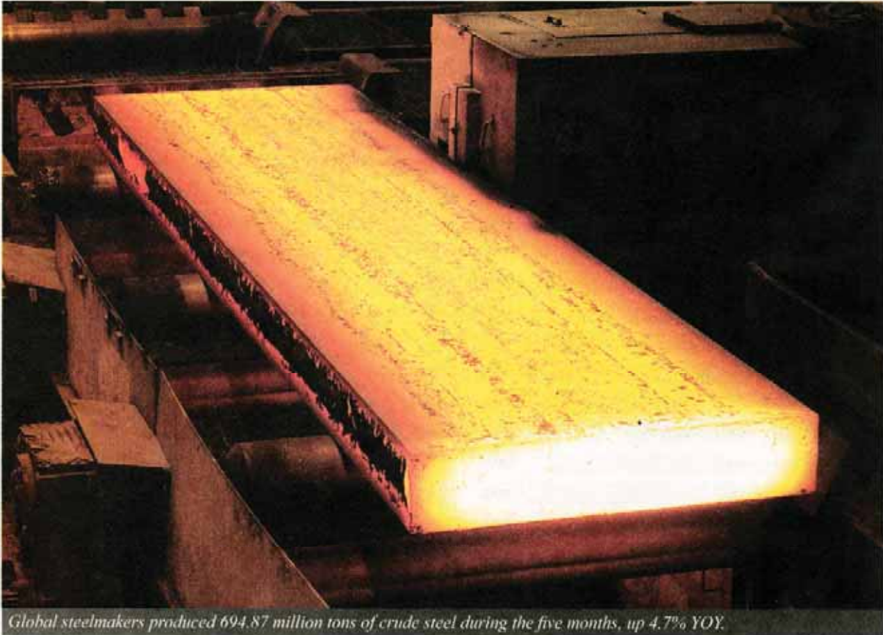
Global steelmakers produced 694.87 million tons of crude steel during the five months, up 4.7% YOY.

with 43.93 million tons, India with 41.82 million tons, the US with 33.97 million tons, Russia with 29.83 million tons, South Korea with 28.42 million tons, Germany with 18.61 million tons, Turkey with 15.09 million tons, Brazil with 14.07 million tons, Italy with 10.26 million tons, Taiwan with 9.25 million tons and