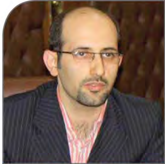
سیدروح‌الله حسینی مقدم

وی افزود: نمایندگانی از ایمیدرو، وزارت صنعت، معدن و تجارت، مدیران هلدینگ‌ها، شرکت‌های بورسی و غیربورسی در این جلسه حاضر شدند و نکاتی درباره فراهم کردن امکان عرضه کلوخه سنگ آهن در بورس کالا مطرح شد. نیازسنجی و پیگیری بازار سرمایه در حوزه‌های مختلف صنعت یکی از این دستاوردها بود. از سوی دیگر درباره موضوع بهره مالکانه و حقوق دولتی مبنی بر اینکه چگونه می‌شود وضعیت را بهبود داد یا چگونه به شکل کارآمدتری می‌توان در بلندمدت این حقوق را اجرایی کرد، صحبت شد. معاون سازمان بورس تاکید کرد: هیچ کس منکر این نیست که حقوق مالکانه باید پرداخت شود، اما با توجه به تجربه دنیا باید انعطاف‌پذیر بود تا بتوان به توسعه صنعت کمک کرد.