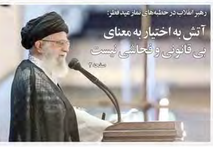
رهبر انقلاب در خطبه‌های نماز عید فطر: آتش به اختیار به معنای بی قانونی و فحاشی نیست

مشکلات بانکی بهبود بین مانع جذب سرمایه گذاری خارجی ایران-حاجا احمد در خطبه عید فطر ایران-حاجا احمد در خطبه عید فطر ایران-حاجا احمد در خطبه عید فطر