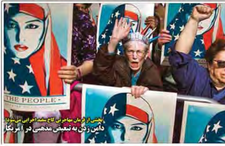
بخشی از فرمان مهاجرتی کاخ سفید اجرایی می‌شوند دامن زکین به تبعیض مذهبی در آمریکا

بررسی روند تغییر سیاست‌کالاهای برده‌صرف کشور در ماه رمضان!