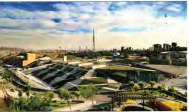
باغ کتاب تهران ۱۲ تیر به ثمر می‌نشیند

دیوان عالی آمریکا تقاضای ضبط آثار تاریخی ایران برای پرداخت غرامت به افرادی که ادعا می‌کنند قربانیان حملات تروریستی هستند را مورد بررسی قرار می‌دهد.