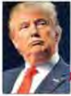
ریسمن جمهوری آمریکا ناتجرب‌ترین رهبر جهان