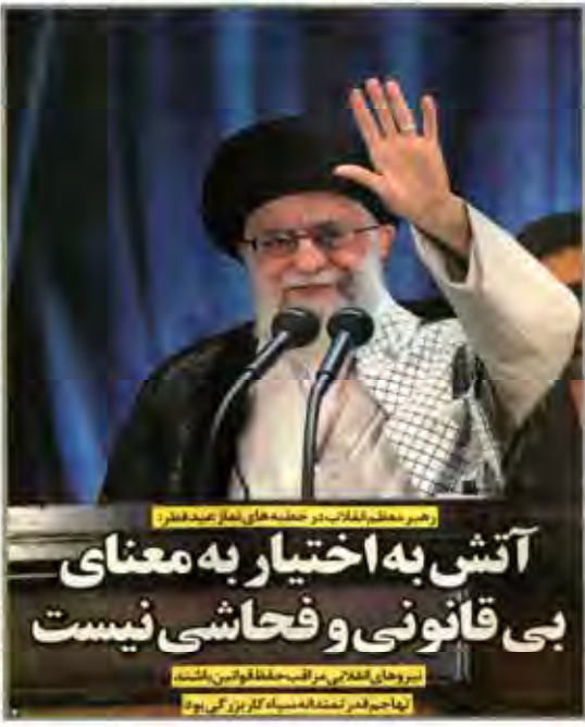
رئیس مجلس انقلابی در حین سخنرانی اعلام می کند:

رئیس جمهور با اشاره به حضور دشمنان در منطقه، گفت: دشمنان نمی توانند در همدلی و اتحاد ملی ما خلی وارد کنند. ما با وجود دشمنان، به سمت پیشرفت و توسعه حرکت می کنیم. دشمنان هر چه بکنند، ما را از مسیر خود منحرف نمی کند.