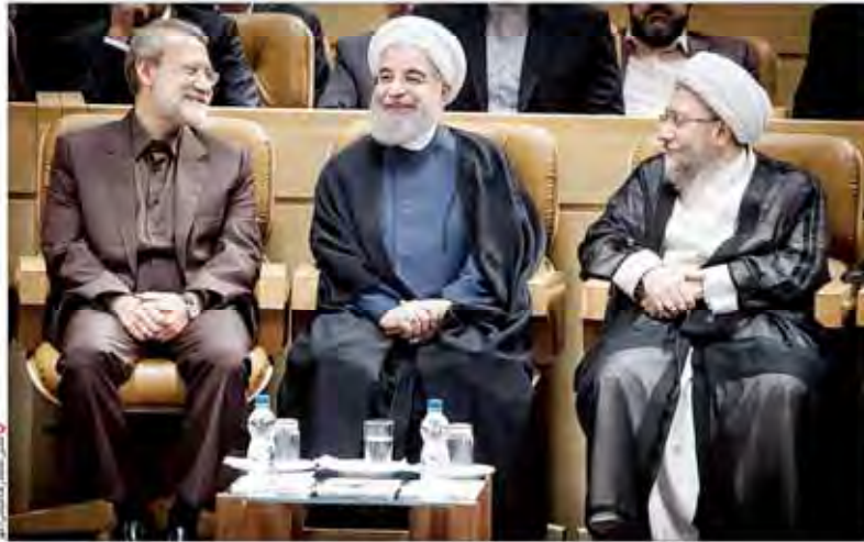
رئیس جمهوری در همایش سراسری قوه قضائیه:

عضو کمیته علمی انجمن ام‌اس، ابتلای ام‌اس در کودکان، بیماری نادر به شمار می‌رود اما موارد بیشتری از ابتلای کودکان به ام‌اس دیده می‌شود کودکان مبتلا به ام‌اس در قالب طرح ملی ۳ ساله شناسایی می‌شوند