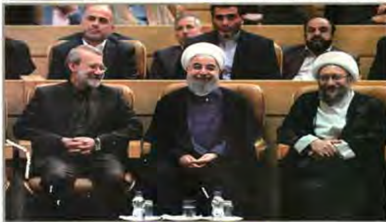
رئیس‌جمهوری در همایش سراسری قوه قضائیه مطرح شد