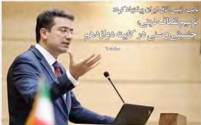
نایب رئیس اتاق ایران پیشگاه کرد ترمیم شکاف دینیه جنسیتی و سنی دو گایینه دوازدهم