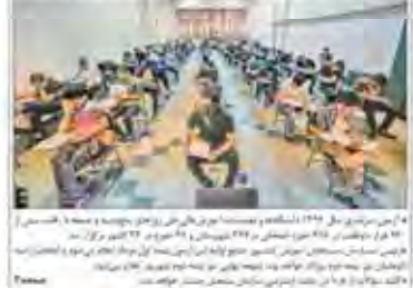
آزمون سرسری دانشگاهها با رانندگی بیش از ۹۳۰ هزار داوطلب برگزار شد