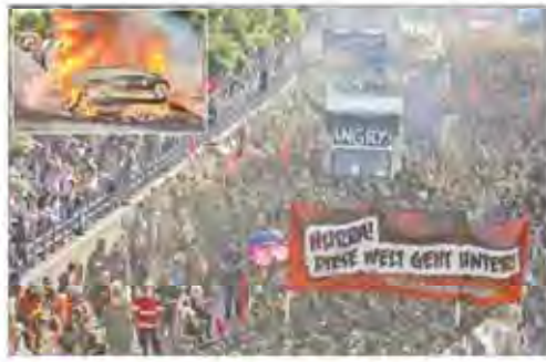
مخالفان سرکوب شدند، ارتش برای سرکوب معترضان به میدان آمد

سهم ۵۰/۱ درصد توتال جایز برای مدیریت ایران باقی نمی گذارد سهم ۵۰/۱ درصد توتال جایز برای مدیریت ایران باقی نمی گذارد سهم ۵۰/۱ درصد توتال جایز برای مدیریت ایران باقی نمی گذارد