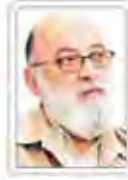
بدهی یا طلبی؟

بدهی یا طلبی؟ بدهی یا طلبی؟ بدهی یا طلبی؟