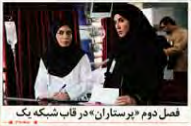
فصل دوم «پرستاران» در قاب شبکه یک