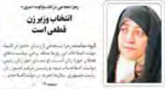
انتخاب وزیر زن قطعی است