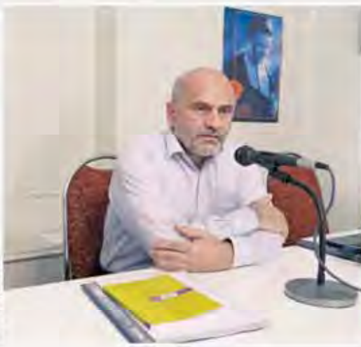
گزارش جهان اقتصاد از مراسم یادبود شهادت آیت الله بهشتی در مؤسسه دین و اقتصاد