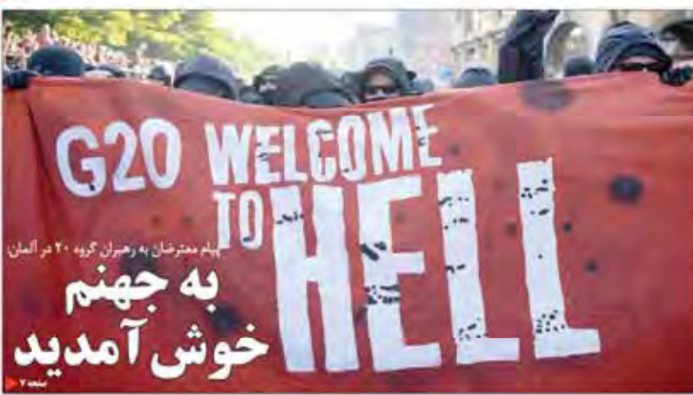
پیام معترضان به رهبران گروه ۲۰ در آلمان به جهنم خوش آمدید

سخت‌گیر خط قرمز برای دولت است استدلالی صحت بخش می‌شود ایران از روی زمین می‌ماند دولت باید در زمینه‌های مختلف با کشورهای دیگر همکاری کند و از روی زمین نماند.