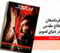
فرماندهان دفاع مقدس در دنیای تصویر