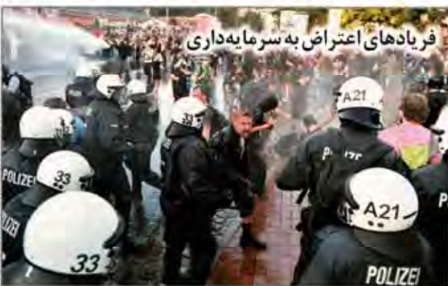
فریادهای اعتراض به سرمایه‌داری