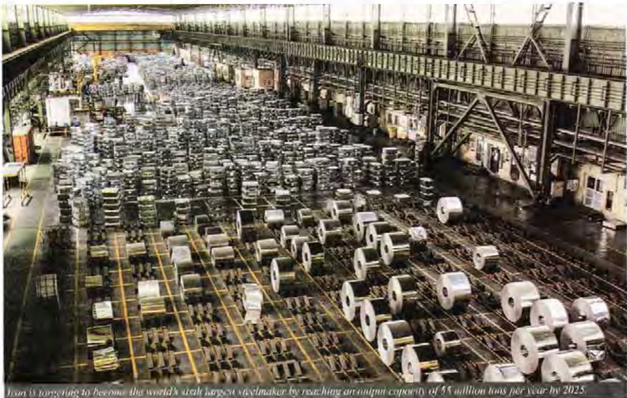
Iran is targeting to become the world's sixth largest steelmaker by reaching an output capacity of 55 million tons per year by 2025.