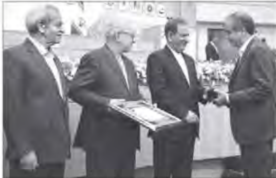
هم بخش خصوصی باید برای پیشرفت کشور حتما تلاش کند.

جهانگیری تأکید کرد: بخش خصوصی باید مورد حمایت قرار گیرد باید سیاست‌های اصل ۲۲ قانون اساسی که بارها رهبری گلابه کردند که وقتی من این سیاست‌ها را اعلام کردم فکر کرده بگتجول و انقلاب بزرگی در اقتصاد کشور می‌افتاد، این چنین نشد باید دولت دوازدهم با پیگیری که در دولت یازدهم انجام شد سیاست‌های اصل ۲۲ قانون اساسی را دنبال کند.