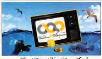
شبکه مستند، خانه مستندسازان