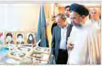
با حضور دکتر سید محمود علوی و وزیر فرهنگ و ارشاد اسلامی در مراسم رونمایی

ماهه تفاوت افزایش حقوق مستمری بگیران تا مین اجتماعی ۳۰ تیر واریز می‌شود