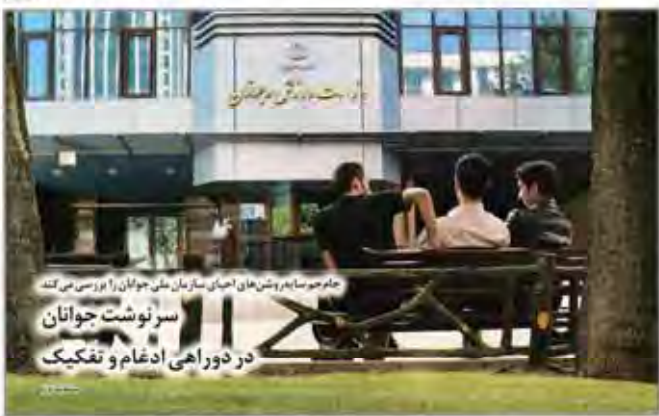
جامه‌ها و پیراهن‌ها از اهالی رسانه ملی جوانان را بر سر می‌کشد سر نوشت جوانان در دوراهی ادغام و تفکیک