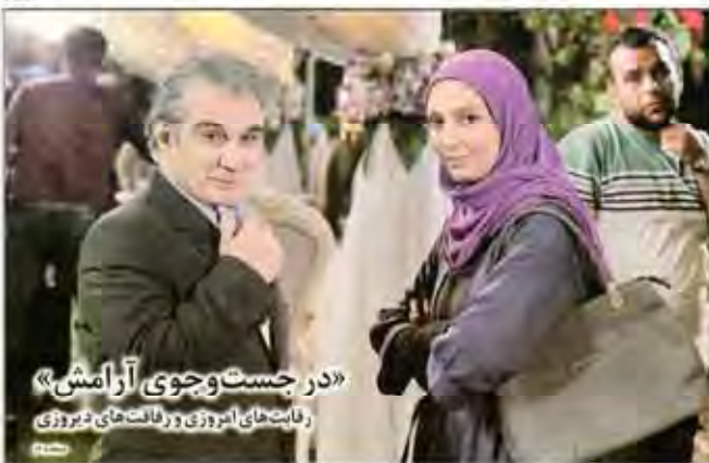
«در جستجوی آرامش»... زبانت‌های امروزی و زبانت‌های دیروزی