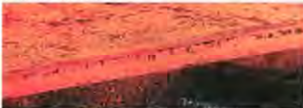
Oxin is the only Iranian producer of heavy wide steel plate and is able to produce it in widths of 1,100-4,500 millimeters with a thickness of 8-150 mm.

The EU set up duties of up to 35.9% on imports of hot-rolled flat steel from China back in June to counter what it says are unfair subsidies.