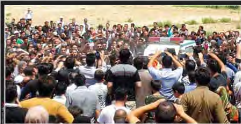
بیکر آشنا با حضور گسترده مردم پاریس آباد به خاک سپرده شد

بی‌آبی نوع جدید مهاجرت را در میان ایرانیان رقم زده و مردم را به البرز و زاگرس کوچانده است نوبخت، معاون امور جنگل سازمان جنگل‌ها، سفره‌های زیر زمینی نسبت به دریاچه ارومیه موقعیت بدتری دارند