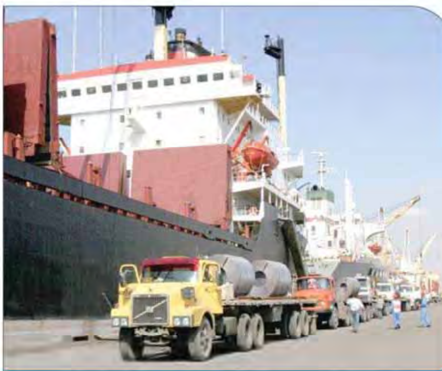
تنگ خلیفه از منطقه قبل

تاکید بر تشکیل یک کنسرسیوم برای متشکل شدن تولیدکنندگان صادراتی عنوان کرد، اگر صادرکننده‌ها به صورت جمعی و کنسرسیومی یا همدیگر عمل کنند، از حمایت‌های بیشتری در بحث تامین مالی و صندوق ضمانت صادرات و رویه‌هایی که دولت برای صادرات در نظر می‌گیرد، بهره‌مند خواهند شد و به صورت متشکل بهتر می‌توانند عمل کنند. پس کنترل قیمت و کیفیت هدف تشکیل کنسرسیوم صادراتی است.