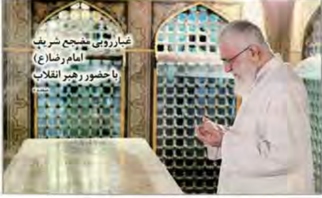
غباروویی مضجع شریف (امام رضا) با حضور رهبر انقلاب

جام جم از راه اندازی مرکز تجارت ترکیه در تهران گزارش می دهد