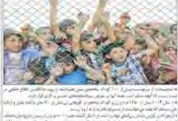
۱۰۰ کودک پناهجوی معقول شده در انگلیس قربانی باندهای فساد شدند

● ۱۰۰ کودک پناهجوی معقول شده در انگلیس قربانی باندهای فساد شدند. ● این کودکان در شرایط سختی زندگی می‌کنند. ● این کودکان در شرایط سختی زندگی می‌کنند.