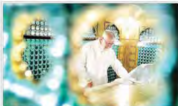
غباروویی مضجع مطهر حضرت امام رضا(ع) با حضور رهبر معظم انقلاب

نشست شورای امنیت و شورای عالی امنیت ملی نشست اضطراری شورای امنیت در مورد بحران مسجد الاقصی برگزار شد. شورای عالی امنیت ملی نیز در مورد این موضوع جلسه برگزار کرد.