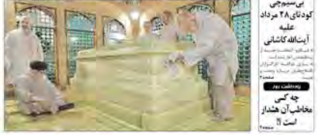
غبار رویی مضجع مطهر حضرت امام رضا (ع) با حضور رهبر انقلاب

● غبار رویی مضجع مطهر حضرت امام رضا (ع) با حضور رهبر انقلاب. ● این مراسم در مشهد مقدس برگزار شد. ● این مراسم در مشهد مقدس برگزار شد.