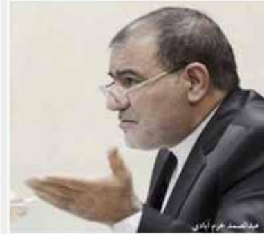
خطابه تند معاون فناوری دادستان علیه تلگرام و وزیر از نیماشات و شبکه ملی اطلاعات