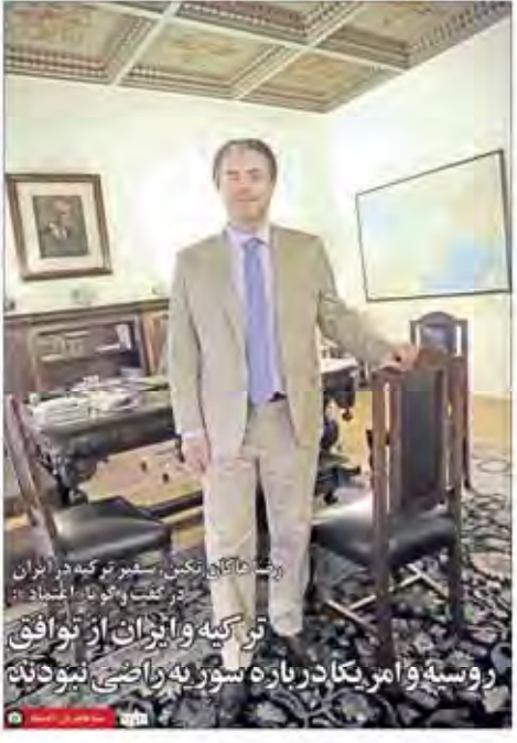
روزنامه های تهران، پیگیری ترکیه در ایران ترکیه و ایران، توافق روسته و امریکادر بازه سوریه راضی نبودند

انتظارات مان از کابینه دوازدهم را واقعی کنیم به نظر می آید که کابینه دوازدهم در صورت تشکیل شدن، با چالش های زیادی روبرو خواهد شد. در این باره، کارشناسان سیاسی معتقدند که رهبری در انتخاب کابینه، نقش تعیین کننده ای دارد. انتظار می رود که کابینه دوازدهم، با در نظر گرفتن انتظارات مردم و مجلس، اقدامات لازم را برای حل مشکلات کشور انجام دهد.