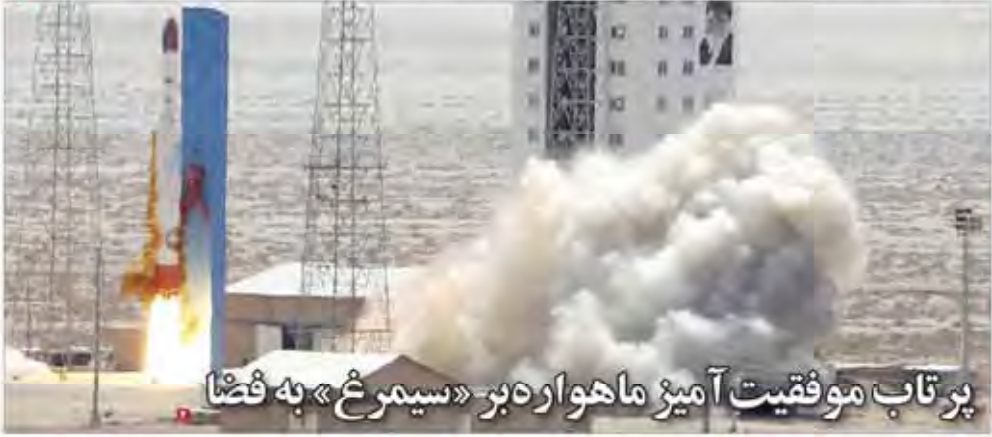
پرتاب موفقیت آمیز ماهواره بر «سپهر» به فضا