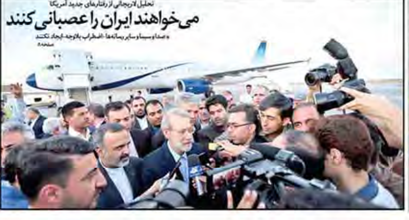
تحلیل لایحه جاتی از رفتارهای جدید آمریکا می خواهند ایران را عصبانی کنند

ترمز تابستانی نرخ تورم نرخ تورم در تابستان به ترمز رسیده است. این امر نشان دهنده موفقیت سیاست های دولت در کنترل تورم است. با توجه به سیاست های دولت در زمینه های اقتصادی، انتظار می رود که نرخ تورم در سال آینده نیز کنترل شود.