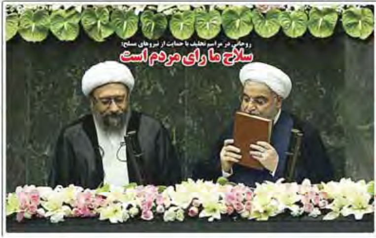
روحانی در مراسم تحلیف با حمایت از روحانی مسلح سلاج ما رای مردم است

تولیدکنندگان برای کاهش ریسک اقتصادی خود که همواره طی سالیان گذشته در بازارهای جهانی تجربه کرده‌اند و در این خصوص سوخ و سوزانی بسیار دارند. این تولیدکنندگان خواهان کاهش نرخ ارز و افزایش صادرات است. همچنین کاهش نرخ ارز و افزایش صادرات است.