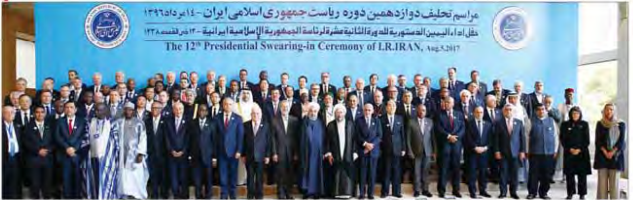
مراسم تحلیف دوازدهمین دوره ریاست جمهوری اسلامی ایران - ۱۴ مرداد ۱۳۹۶ دخول آباء الیومین الدستورية للهرة الثانیة عشرة لرئاسة الجمهورية الإسلامية الإيرانية - ۱۳ در لقمه ۱۳۹۶ The 12th Presidential Swearing-in Ceremony of LR.IRAN, Aug 5, 2017