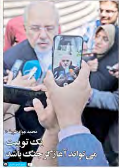
محمد جواد ظریف یک توپیت می‌تواند آغازگر جنگ باشد

اربابان گاراژ زباله آلودگی ناشی از گاراژهای زباله در تهران یکی از دلایل اصلی آلودگی هواست. شهرداری باید تدابیر جدی‌تری اتخاذ کند.