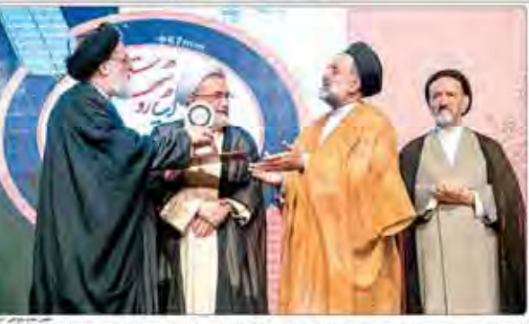
اختتامیه سومین جشنواره ملی تجلیل از خبرنگاران و رسانه‌های برتر در حوزه ایثار و شهادت