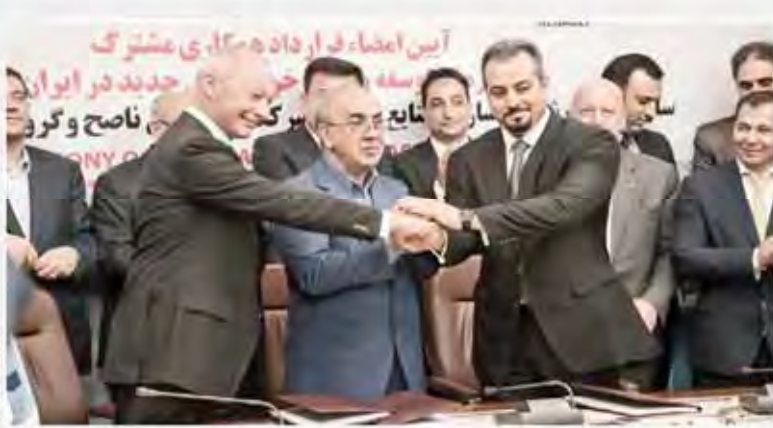
قرارداد زو زو فرسه و ایدرو ایران با ارزش ۲۲۰ میلیون یورو بسته شد. بزرگترین سرمایه‌گذاری تاریخ صنعت خودرو ایران

۱۲ آریه وزیر تعاون، کار و رفاه اجتماعی اعلام کرد که احتمال ادغام شرکت‌های بیمه در کشور وجود دارد. وی افزود: این ادغام می‌تواند به نفع بیمه‌گذاران باشد. ۱۳ آریه پژوهشگران ایرانی موفق شدند یک روش جدید برای تشخیص زودهنگام سرطان کبد را معرفی کنند. این روش می‌تواند به بیماران مبتلا به این سرطان خطرناک کمک کند. ۱۴ آریه فرماندهای نیروهای مسلح ایران اعلام کردند که این نیروها در حال مبارزه با تروریسم و قاچاق کالا و ارز در مناطق مختلف کشور هستند. ۱۵ آریه احتمال پیوستن لیبی و لیبیا به برنامۀ کاهش تولید و وجود دارن کاهش تولید نفت در این کشور. ۱۶ آریه فرماندهای نیروهای مسلح ایران اعلام کردند که این نیروها در حال مبارزه با تروریسم و قاچاق کالا و ارز در مناطق مختلف کشور هستند.