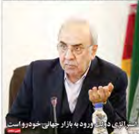
استراتژی دولت ورود به بازار جهانی خودرو است