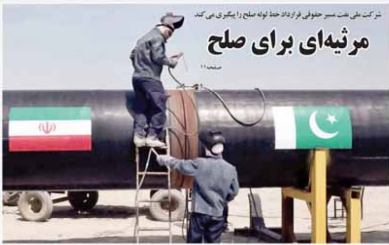
شرکت ملی نفت مسر جنوبی فرادان خط لوله صلح را با بگیری می‌کند. مرثیه‌ای برای صلح