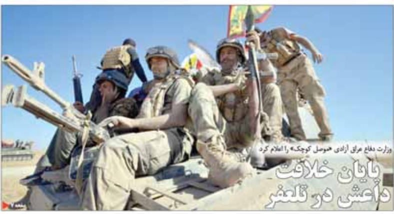
وزارت دفاع مریز آزادی هوسل کوچک را اعلام کرد بایان خلافت داعش در قلعه شمر

سرمایه غیرت میثاق از دستاوردهای اقتصادی دولت دوازدهم در مراسم تجدید میثاق با آرمان‌های امام راحل، دستاوردهای اقتصادی خود را در چهار سال گذشته به مردم عرضه کرد. روحانی در این مراسم به دستاوردهای مهمی در بخش تولید، معادن و تجارت اشاره کرد.