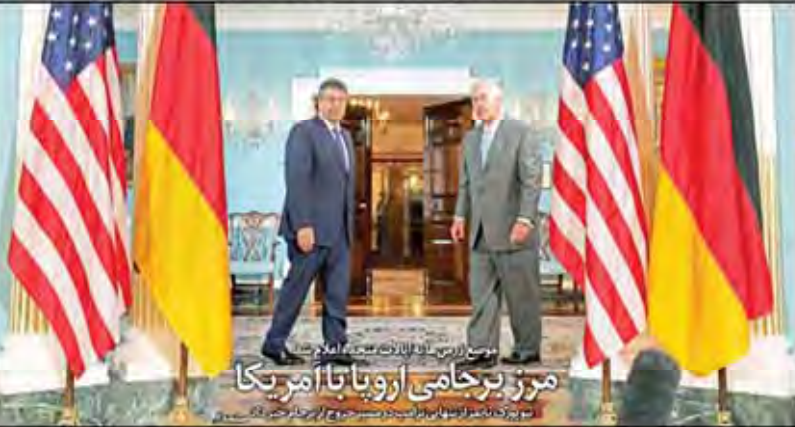
موسس زرمینی با ایلان ماسک در واشینگتن

بر اساس گزارش‌های اخیر، اقتصاد روسیه با چالش‌های جدی مواجه شده است. این کشور در حال تلاش برای تنوع بخشیدن به اقتصاد خود است، اما همچنان وابستگی زیادی به نفت و گاز دارد. این وابستگی می‌تواند به عنوان پاشنه آشیل اقتصاد رفاقتی روسیه عمل کند.