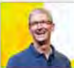
۹۰ میلیون دلار بازاریابی برای اینجین