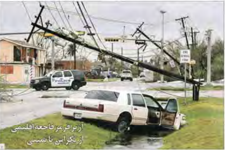
از زیر فرمان قاجحه قلبمی از نگرانی تا بهستی

از روز شنبه نرخ سود سپرده‌های بانکی جدید حداکثر ۱۵ درصد خواهد بود