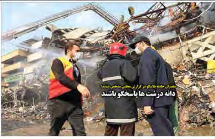
مستمران حکایتی پلاسکو در گزارش مجلس ضمنی شدت دانه درشت ها پاسخگو باشند

های موسسه - انفرادی در شهری خلیل ۲۰۱۶ و چندین دهی در آن کوچک گرمین دولت به یک وقت نخستین در آن تبدیل شده به طور که تعداد از حدود گشتند و گذارید مرکز کتانی دهانی به بخش موسسه و یکی همچنان کشد درم در