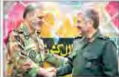
دیدار صمیمانه فرماندهان سپاه و ارتش

۹ ارتش و سپاه پاسداران انقلاب اسلامی در یک دیدار صمیمانه و دوستانه با یکدیگر دیدار کردند. در این دیدار، فرماندهان ارشد ارتش و سپاه با یکدیگر گفت‌وگو کردند و به موضوعات مختلف نظامی و امنیتی پرداختند. این دیدار در محل مقر سپاه پاسداران انقلاب اسلامی برگزار شد.