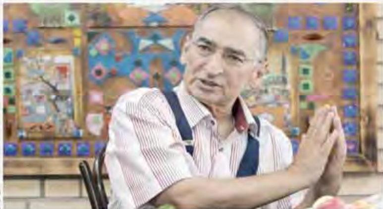
پررسی پیدا و پنهان خط مشی رئیس جمهور در گفتگوی جهان اقتصاد با صادق زیبا کلام آتش بس معنادار روحانی با دلوپاسان