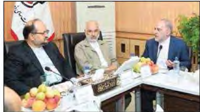
تولید ریل ملی برای دولت از اهمیت ویژه ای برخوردار است وزیر صنعت، معدن و تجارت در نخستین سفر کاری خود را بعد از معارفه رسمی به اصفهان آمد و از خط تولید ریل در نورد ذوب آهن اصفهان بازدید کرد.

وی در این بازدید و در گفتگو با خبرنگاران اظهار داشت: هدف از حضور در ذوب آهن این بود که بگوییم وزارت صنعت، معدن و تجارت در کنار ذوب آهن است و از هیچ کوششی برای حل مشکلات آن دریغ نمی کنیم. وی افزود: تولید ریل یک اقدام بزرگ است که توسط ذوب آهن انجام شد و این امر برای دولت از اهمیت ویژه ای برخوردار است.