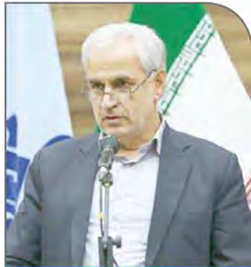
محمد رضا صالحی

استاندار خراسان شمالی نیز در آیین آغاز به کار پروژه برداشت اطلاعات ژئوفیزیک هوایی در خراسان شمالی با اشاره به اینکه معدن یکی از فرصت‌های اقتصادی در این استان است گفت: توسعه معادن از برنامه‌های اولویت‌دار این خطه از کشور است.