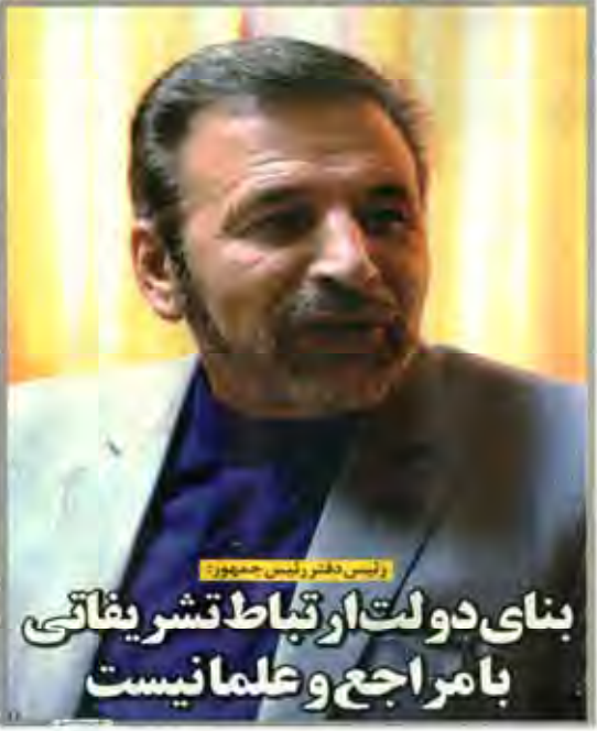
رئیس دفتر رئیس‌جمهور