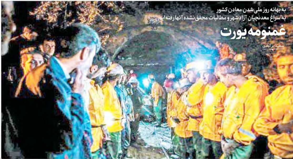
به بهانه روز ملی شدن معادن کشور به سراغ معدنچیان آزادشهر و مطالبات محقق نشده آنها رفته‌ایم