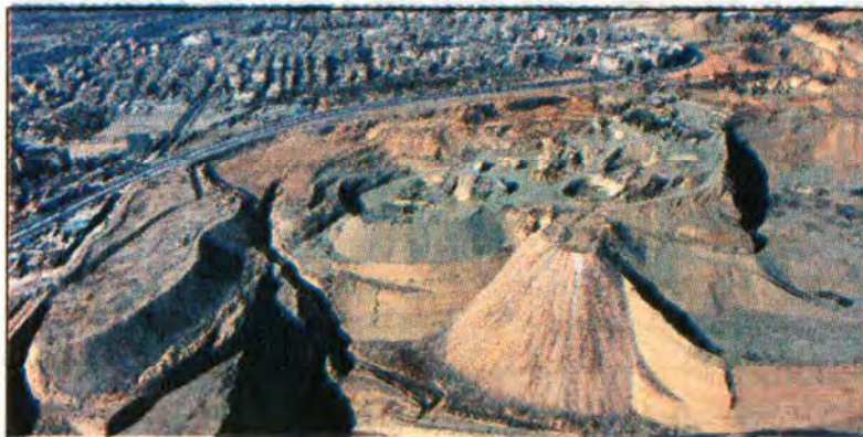
معادن شن و ماسه منطقه ۱۸؛ گول‌هایی که پای آنها بسته شد.

از طرف دیگر با اجرای آن فضاهای تفریحی، فرهنگی و اقتصادی متنوعی ایجاد می‌شود که می‌تواند تحولی قابل توجه را در جنوب غرب پایتخت به دنبال داشته باشد. این طرح فرامنطقه‌ای که رأی کمیسیون ماده ۵۰ نیز دارد، در قالب طرح توسعه اراضی کن ترسیم شده است. هم‌اکنون شرکت فریت برای فراهم آوردن مقدمات کار مشغول برداشتن دیوار بسیار بزرگ با معدن همسایه خود یعنی معدن خلیج است. این دو معدن مجموعاً بیش از ۲۰۰ هکتار وسعت دارند و بسته بودن راه‌ها کار تردد ادوات و کامیون‌ها را در عملیات دیواربرداری سخت کرده چرا که راننده‌ها مجبورند از طریق بزرگراه آزادگان و طی مسافت بسیار زیاد در داخل گودال‌ها به دیوار خاکی مورد اشاره برسند.