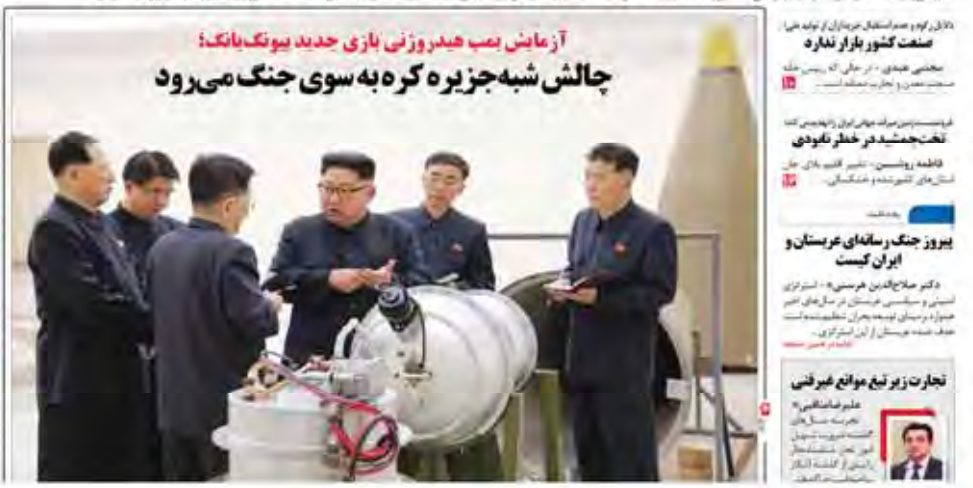
کیم جونگ ایل، رهبر کره شمالی، در کنار مقامات نظامی پس از آزمایش بمب هیدروژنی در استان همدان، کره شمالی.