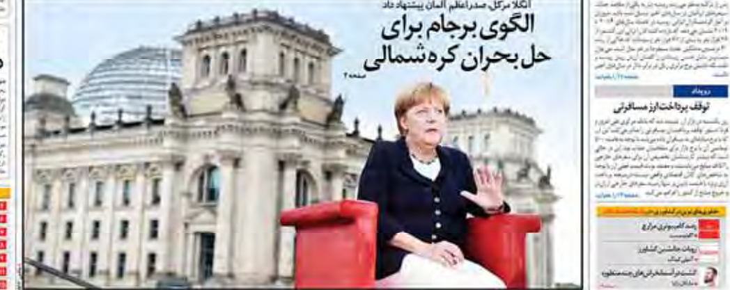
انگلا مرکل، صدراعظم آلمان پیشنهاد داد الگوی برجام برای حل بحران کره شمالی