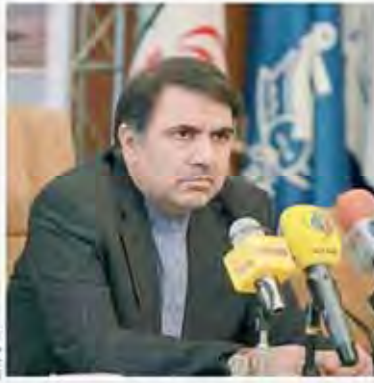
وزیر راه و شهرسازی مطرح کرد تمرکز بر تقاضا راهکار حل مشکل مسکن