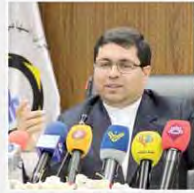
در نشست مشترک مدیرعامل بورس کالا با مسئولان استان فارس تاکید شد برگشت سرمایه کشاورزان با عرضه محصولات در بورس