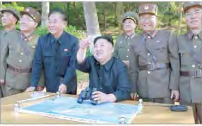
کیم جونگ ایل، رهبر کره شمالی، در کنار مقامات نظامی پس از آزمایش بمب هیدروژنی در استان همدان، کره شمالی.