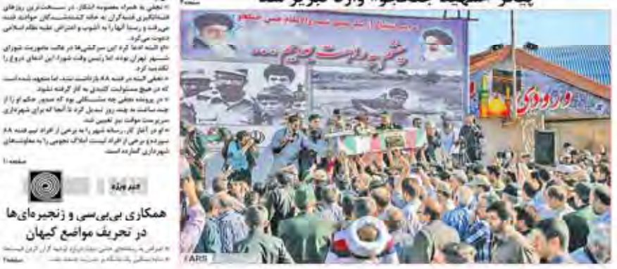
پیکر «شهید جنگجو» وارد تبریز شد

۵ درصد هم توان پاسخگویی علمی به مسائل محیط زیست را ندارم!