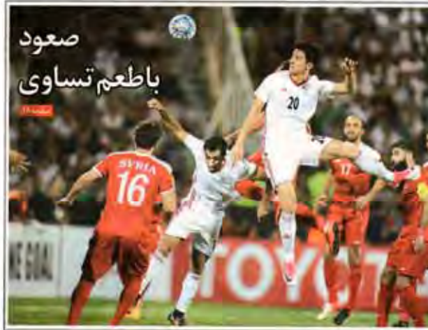
صعود باطعم تساوی