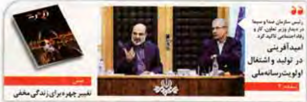
امید آفرینی در تولید و اشتغال اولویت رسانه ملی

روزنامه هفتگی - انتشارات جام جمعه - تهران - شماره ۱۳۹۶ - ۱۳ شهریور ۱۳۹۶ - ۱۳۹۶ - ۱۳ شهریور ۱۳۹۶ - ۱۳۹۶ - ۱۳ شهریور ۱۳۹۶