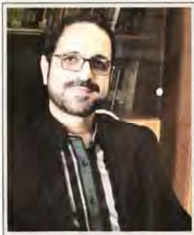
میشه در بازدید از عصر اقتصاد اعلام کرد صندوق ضمانت سرمایه‌گذاری صنایع کوچک گره‌گشای اعتبارات وثیقه محور