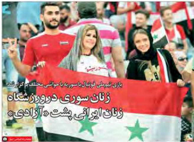
بازی تیم ملی فوتبال باسوریه با حواشی مختلف برگزار شد. زنان سوری در ورزشگاه زنان ایرانی پشت «آزادی»