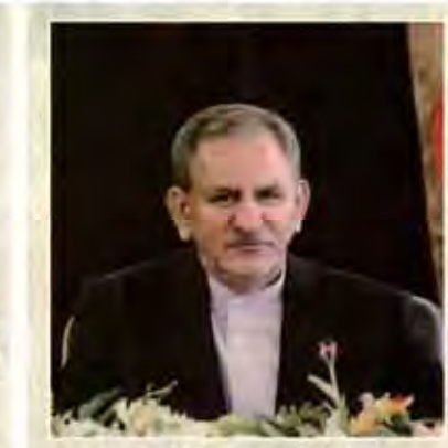
معاون اول رئیس جمهور تاکید کرد: اراده دولت بر اجرای برنامه های اقتصاد مقاومتی است

رئیس هیئت وزیران در دیدار با استاندار تهران: تهران مصمم به توسعه روابط اقتصادی با اسلام آباد است رئیس هیئت وزیران در دیدار با استاندار تهران: تهران مصمم به توسعه روابط اقتصادی با اسلام آباد است رئیس هیئت وزیران در دیدار با استاندار تهران: تهران مصمم به توسعه روابط اقتصادی با اسلام آباد است رئیس هیئت وزیران در دیدار با استاندار تهران: تهران مصمم به توسعه روابط اقتصادی با اسلام آباد است