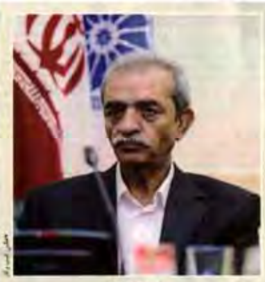
رئیس اقل ایران: روابط سیاسی پایدار در گرو روابط اقتصادی منسجم است