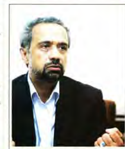
غفلت بخش خصوصی از زحمات نهاندینان به خاطر منافع محدود