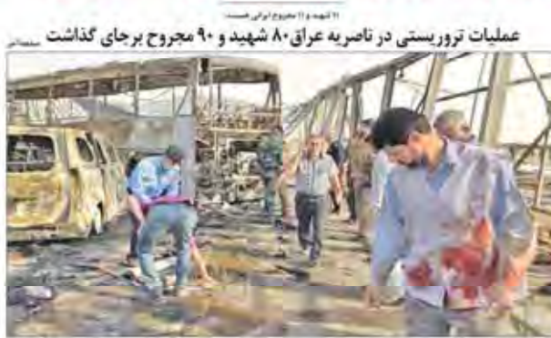
عملیات تروریستی در ناصریه عراقی ۸۰ شهید و ۹۰ مجروح برجای گذاشت

آمریکا همزمان با تایید برجام، فروش هواپیما به ایران را ممنوع کرد!