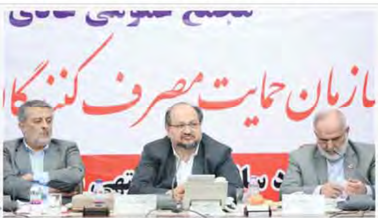
داخوری وزیر و اشاره به شعل و فساد در نهاد ناظر بازار