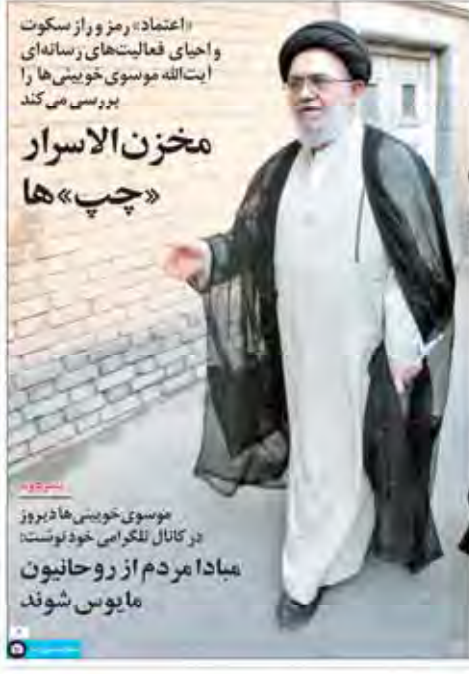
موسوی خویی، مرموز و راز سکوت و احیای فعالیت‌های رسانه‌ای آیت‌الله موسوی خویی‌ها را بررسی می‌کند

باز دیگر شهری که دوست می‌داشتیم استان قم به دلیل موقعیت استراتژیک و تاریخی آن، همواره یکی از شهرهای مهم و پررونق کشور بوده است. در این مقاله به بررسی ویژگی‌های این شهر و دلیل دوست داشتن آن می‌پردازیم.