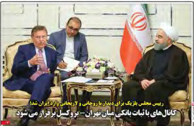
رئیس مجلس بلژیک برای دیدار با روحانی و لاریجانی وارد ایران شد؛ کانال های با ثبات بانکی میان تهران - بروکسل برقرار می شود

خروج ادواری ایران از منطقه استامبول - حقیقت امر اینست که مردم توان می دهند