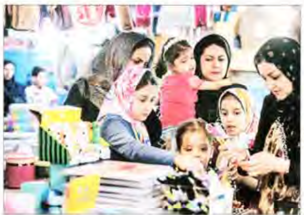
مداد پاک کن، خط کش و... با اینها مهم‌رم را آغاز می‌کنم نماینده ایران نوشت در پنجمین دوره برای شش بار هم خط‌اندازهای ایرانی را به خرید نوشتاراز تولید ایران تشویق کرد

بیداری مسکن از خواب پنج‌ساله بیم‌و امید در اجرای طرح بلیت نیم‌په