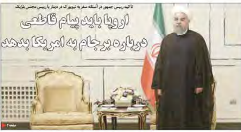
تأکید رییس جمهور در سفر به نیویورک در دیدار با رییس مجلس بلژیک اروپا باید پیام قاطعی در باره پرچام به آمریکا بدهد