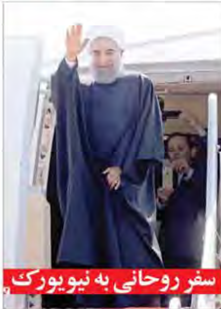
سفر روحانی به نیویورک

سال بیست و هشتم دوره هفده شماره ۴۴۹ پایانی TIAT ۱۶ صفحه قیمت ۱۰۰۰ تومان