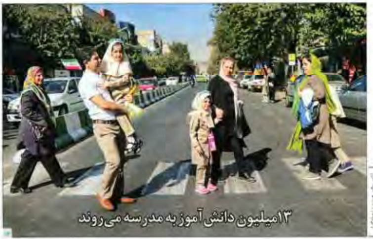
۱۳ میلیون دانش آموز به مدرسه می روند

قرارداد ۱۰۰ میلیون یورویی ایران و انگلیس ایران و انگلیس برای ساخت نخستین نیروگاه بزرگ انرژی تجدیدپذیر دنیا با حجم سرمایه ۱۰۰ میلیون یورویی توافق رسیده است. شرکت انگلیسی ایران در توافقی با انگلیس و تلاش برای انعقاد قرارداد تأمین مالی مذاکره می کند.