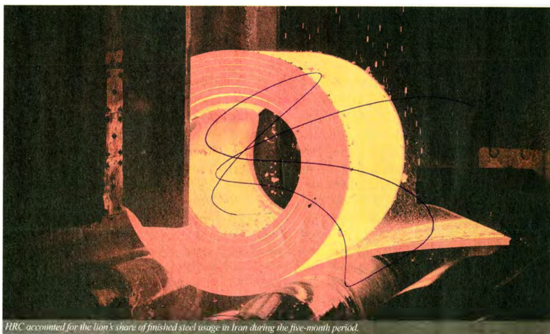
HRC accounted for the lion's share of finished steel usage in Iran during the five-month period.

followed by rebar with 2.32 million tons, down 7% YOY; CRC with 1.25 million tons, up 44% YOY; coated coil with 769,000 tons, up 43% YOY; and beams with 321,000 tons, down 4% YOY.