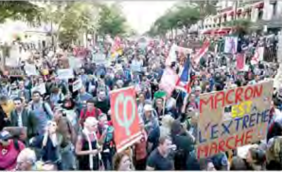
تظاهرات بزرگ مردم پاریس در اعتراض به سیاست‌های اقتصادی مکررون

ابرچالش‌های اقتصاد ایران ناشی از پارادایم «رفاه حاصل از هدررفت منابع» است