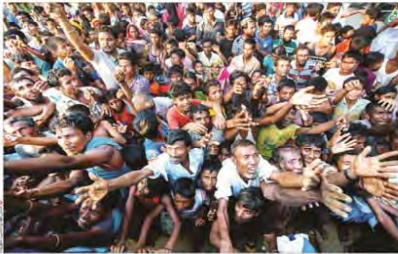
گزارش ویژه «شهروند» از وضعیت پناهیجویان رو هینگیایی و آنچه در میانمار می گذرد

مسعود بارزانی: همه پرسه را برگزار می‌کنیم / عراقی و ترکیه گروه بحران تشکیل دادند / مسعود بارزانی: خواهان تنش با ایران و ترکیه نیستیم