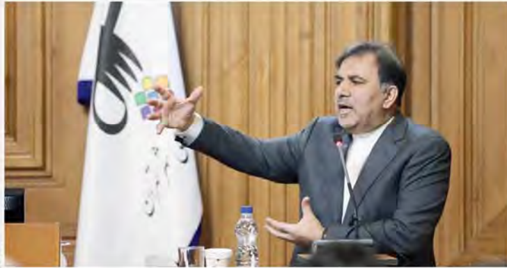
وزیر راه و شهرسازی در صحن شورای شهر تهران مطرح کرد