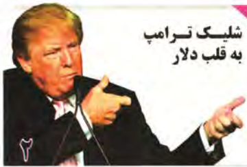
شلیک ترامپ به قلب دلار