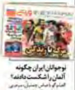
نوجوانان ایران چگونه آلمان را شکست دادند؟