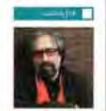
آفتاب همیشه به من ما نایب است