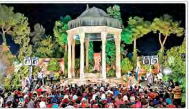
برگزاری یادروز حضرت حافظ با عنوان «شاهد قدسی» در شیراز

■ آیت‌الله العظمی آملی در سخنرانی خود در مراسم یادروز حضرت حافظ با عنوان «شاهد قدسی» در شیراز، اظهار داشت که هیچ اختلافی بین جناح‌ها در مقابله با دشمنان وجود ندارد.