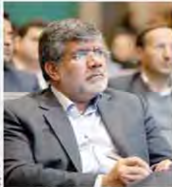
رئیس سازمان توسعه تجارت خبر داد: کاهش نرخ سود تسهیلات صادراتی بر اساس بازار هدف