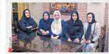
ما هم می‌خواهیم دخترانگی کنیم