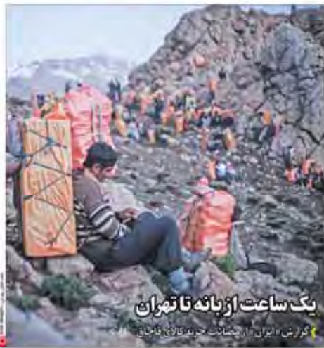
یک ساعت از ناله تاتهران