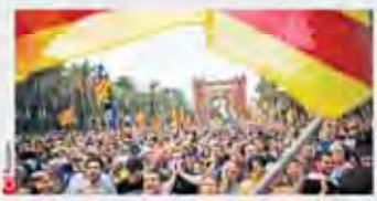
مهر پارلمان کاتالونیا پای سند استقلال