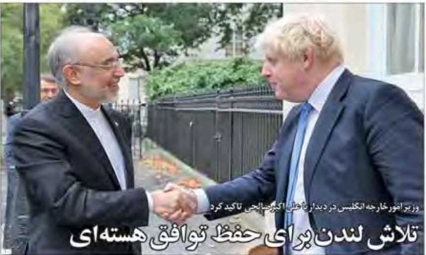
وزیر امور خارجه انگلیس در دیدار با هاشمی اکتبر سالجاری تاکید کرد تلاش لندن برای حفظ توافق هسته‌ای

ایران و افغانستان در مسیر سند جامع راهبردی