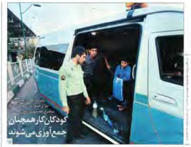
کودکان کار هم‌چنان جمع‌آوری می‌شوند

نرخ دلار در روز پرشتی آرامش داشت. گزارش می‌دهد: «نرخ دلار در روز پرشتی آرامش داشت».