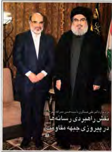
نقش راهبردی رسانه‌ها در پیروزی جبهه مقاومت

صادرکنندگان نمونه کشور در گفت‌وگو با جام جم از چالش‌های پیش رو می‌گویند