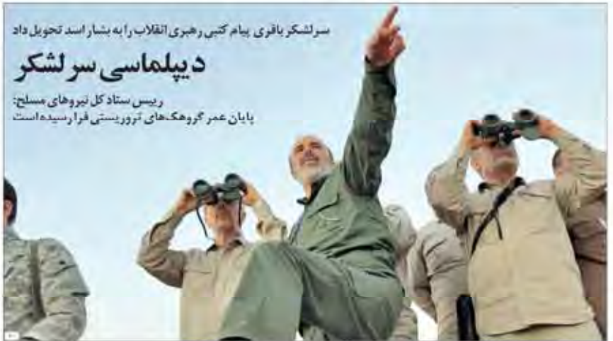
سر لشکر باقری پیام کنی و رهبری انقلاب را به بشار اسد تحویل داد

محمود صادقی: غلامی گزینۀ آله نیست اما قابل قبول است