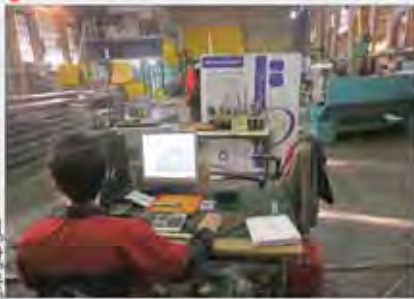
صحنه ای از دفتر کار

شرکت های ایرانی به عنوان سرمایه های شرکت های ایرانی را بررسی کرد. پیش شرط ورود بنگاه ها به بازار جهانی. این شرکت ها باید استانداردهای جهانی را رعایت کنند.