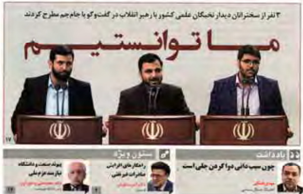
۳ نفر از صادرکنندگان دیدار نخستگان علمی کشور با رهبر انقلاب در گفت‌وگو با جام جم مطرح کردند