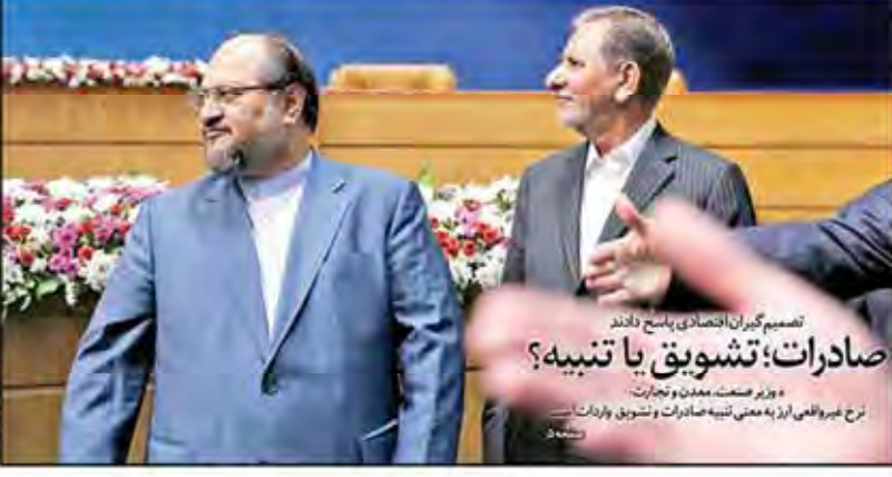
تصمیم گیران اقتصادی پاسخ دادند صادرات؛ تشویق یا تنبیه؟ وزیر صنعت، معدن و تجارت طرح غیر واقعی ارز به معنی تنبیه صادرات و تشویق واردات

شاخص سهام رکورد ۴۵ ماهه را شکست سکوی پرتاب بورس به قله