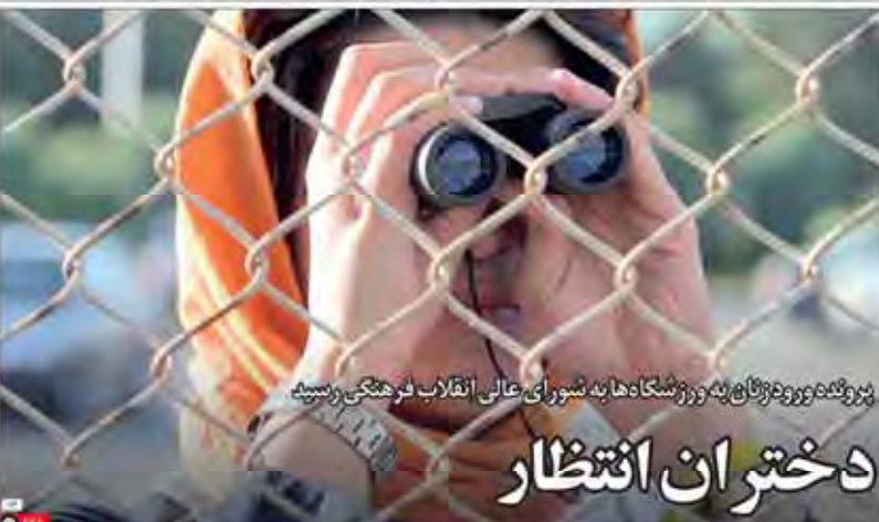
پرونده ورود زنان به ورزشگاه ها به شورای عالی انقلاب فرهنگی رسید دختران انتظار

«استعداد» پیشینه یک طرح حزبی و ابررسی می کند دولت در سایه؛ واقعیت یا کاریکاتور در دنیا نمونه های سراغ نداریم که فقط با جناح های سیاسی کابینه در سایه ایجاد شود