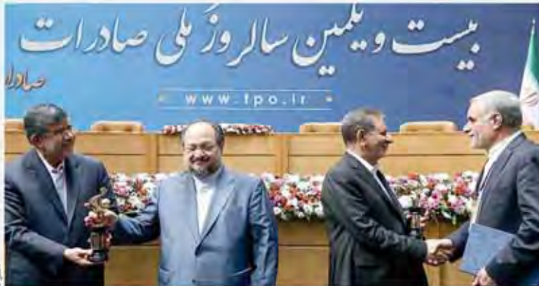
وزیر صنعت، معدن و تجارت در مراسم روز ملی صادرات