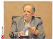
اثر تو لای در گفت‌وگو با «ایران» حلی او چالش‌های ایران در گرو و بیکار چنگی از کمان کشور است