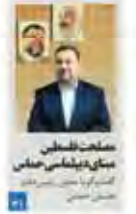
مصلحت‌طلبان بنیاد دین‌داری حیات