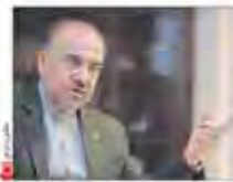
گفت‌وگو با اسطفانی، فروردین و خرداد و خورشید استقلال و پرسپولیس برای من هیچ تفاوتی ندارند