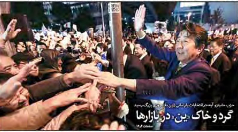
حزب «دین» در انتخابات پارلمانی رأین بزرگ و بزرگ رسید گرد و خاک «دین» در بازارها

«دنیای اقتصاد، خیز خانه اولی ها را از سکوی صندوق یکم، بررسی می کند»