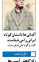
راه کاشن آسیباها در خانه شهرها