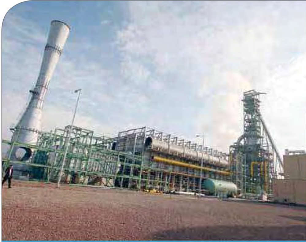
شرکت فولاد خراسان

و در زمستان همان سال واحد ذوب را با ظرفیت ۶۵۰ هزار تن در سال به راه انداخت. این شرکت همچنین واحد احیای مستقیم آهن را با ظرفیت ۱ میلیون و ۶۰۰ هزار تن در سال ۲۰۰۷ میلادی (۱۳۸۶ خورشیدی) راه اندازی کرد. دومین واحد ذوب این مجتمع نیز با ظرفیت تولید ۷۲۰ هزار تن در سال، بهار امسال به راه افتاد.