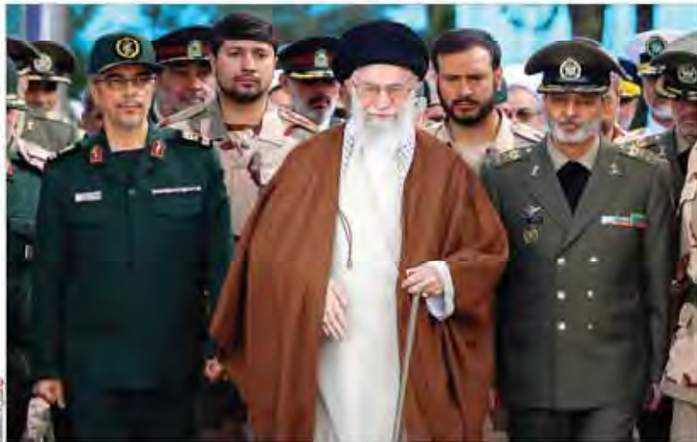
رهبر معظم انقلاب اسلامی در مراسم دانش آموزی دانشجویان دانشگاه‌های افسری ارتش

نخست وزیر ترکیه: اگر قرار بود به نقطه پیش از برگزاری referendum بازگردیم برای چه اتفادر اصرار کردید علی اکبر ولایتی: بالاخره همه چیز طبق پیش بینی ها محقق شد