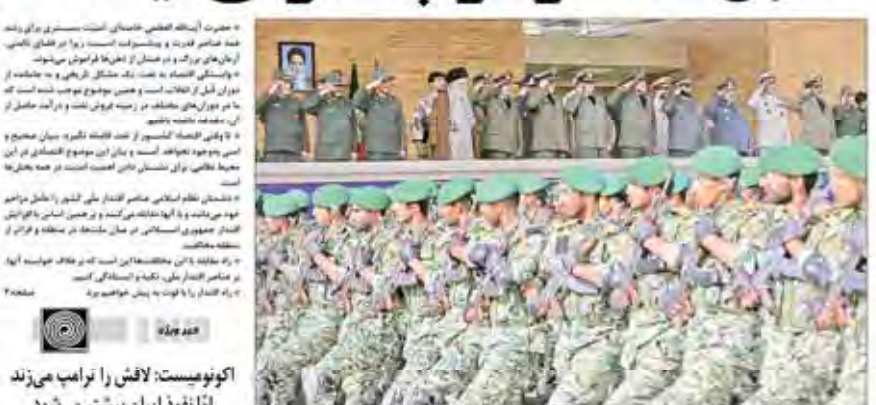
فرمانده کل قوا در دانشگاه افسری امام علی (ع)؛ قدرت دفاعی کشور به هیچ وجه قابل مذاکره و معامله نیست