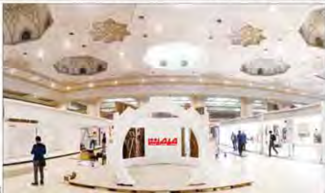
وعده ۵ بدار ما گرفته موسسه فرهنگی مطبوعاتی صنعت معدن تجارت تهران، راهرویی اصلی - گروه موسسه

در فضای مطبوعات، شعارها به ندرت با اقدامات عملی همراه می‌شود. توسعه بیشتر در زمینه‌های اقتصادی و اجتماعی نیازمند برنامه‌ریزی دقیق و پیگیری جدی است.