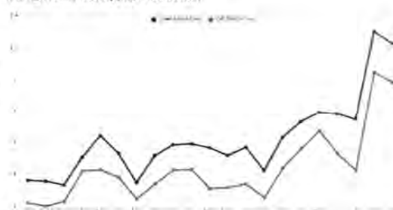
Iran 2016-17 Steel, DRI Production

The crude steel capacity utilization ratio of the 66 countries in September 2017 was 73.5%. This is 2.8% higher than