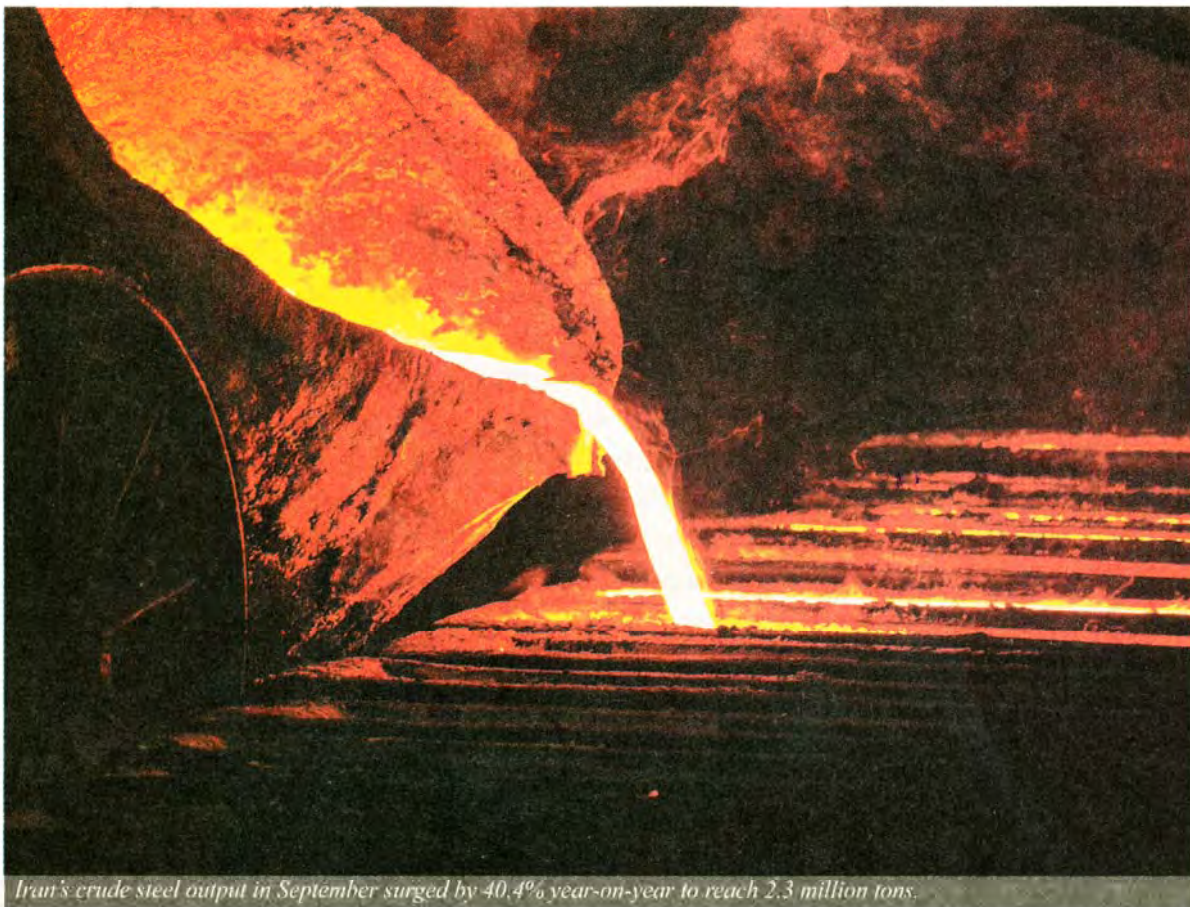
Iran's crude steel output in September surged by 40.4% year-on-year to reach 2.3 million tons.