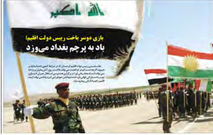
بازی دوسر باخت رییس دولت اقلیم؛ باد به پرچم بغداد می‌وزد. تصویری از یک مراسم نظامی در عراق.

صندوق‌های سرمایه‌گذاری در سرازیری، به دلیل نوسانات شدید بازار سرمایه، با چالش‌های زیادی مواجه شده است. سرمایه‌گذاران باید با احتیاط در این زمینه عمل کنند.