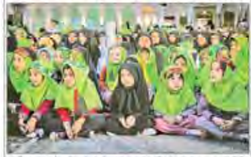
پژوهشگران و محققان ایرانی در نشست علمی در تهران

فرمانده کل قوا در دانشگاه افسری امام علی (ع)؛ قدرت دفاعی کشور به هیچ وجه قابل مذاکره و معامله نیست