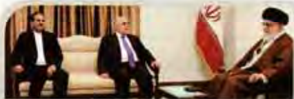
رهبر انقلاب اسلامی در دیدار نخستین روز عراق، مراقب مکر آمریکایی ها باشید