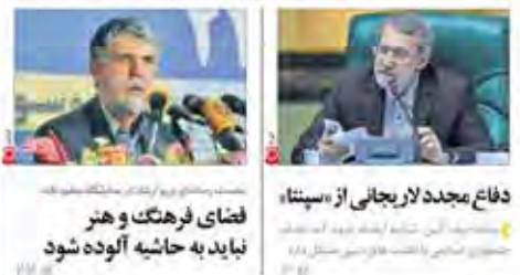
دفاع مجدد لاریجانی از «سینا» سینا: این کتاب که به عنوان هیأت منصفه جرایم سیاسی استان تهران نیز اوراق می‌گردد که روند

اعضای هیأت منصفه مطلوبان سه عنوان هیأت منصفه جرایم سیاسی استان تهران نیز اوراق می‌گردد که روند