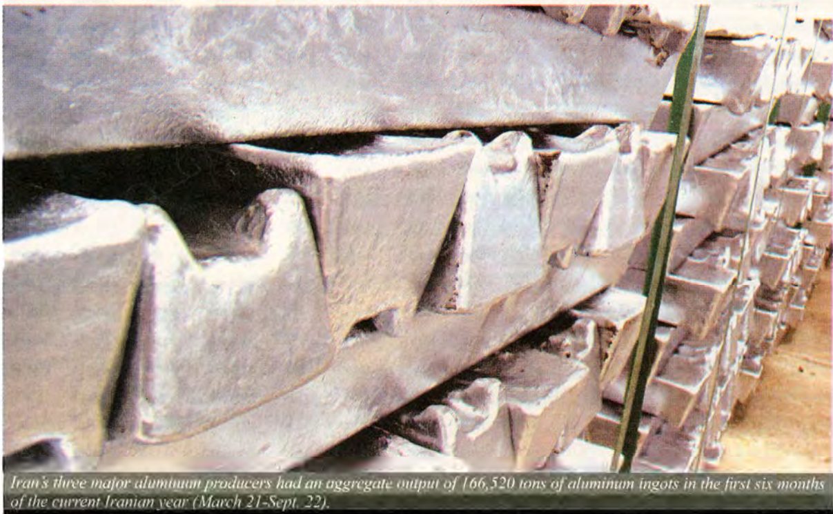
Iran's three major aluminum producers had an aggregate output of 166,520 tons of aluminum ingots in the first six months of the current Iranian year (March 21-Sept. 22).

The country is estimated to hold the world's second-largest reserves of natural gas after Russia, at nearly 18% of global reserves. Much of it is onshore and relatively accessible. China probably figures Iran is too good an opportunity to miss.