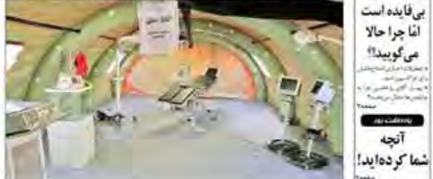
بیمارستان صحرایی در مرز مهرازان تا نجف.

توافق با آمریکا بی فایده است اما چرا حالا می‌گویند؟! آنگاه شما که ده‌اید!