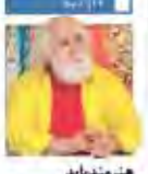
هنرمند باید کشف جهان خود باشد گفتگو با پاپا ریش‌سبز