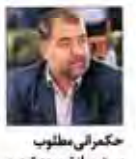
حکمرانی مطلوب بیشتر ساز توسعه شهری یادداشت از مدیرعامل صندوق سرمایه‌گذاری شهر تهران