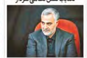
الهادی، سلیمانی در بازدید گبری کرکوک نقش نداشت

فرمانده کل سپاه پاسداران، سردار محمد باقر قالیباف، در دیدار با فرماندهان و کارکنان تیپ‌های مختلف سپاه پاسداران، با اشاره به توانمندی‌های موشک‌های سپاه پاسداران، اظهار داشت: «آمریکایی‌ها به اندازه کافی در تیررس موشک‌های سپاه هستند.»