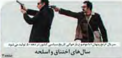
سال‌های اختناق و اسلحه

پیشخوان ۱۰ آبان ۱۳۹۶ - شماره ۲۲۰۰۰ - تهران - ۱۳۹۶ - ۱۲ آبان ۱۳۹۶ - ۲۲ آبان ۱۳۹۶ - ۲۲ آبان ۱۳۹۶