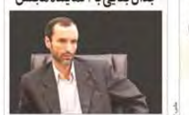
مردی در جلسه مشترک سران سه قوه.

ارتباط ستاره‌ایس جمهوری آمریکا با روسیه باعث ایجاد نگرانی به خود گرفت ترامپ و چالش یک اعتراف