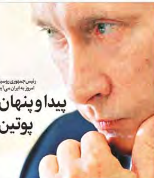
رئیس جمهوری روسیه امروز به ایران می‌آید