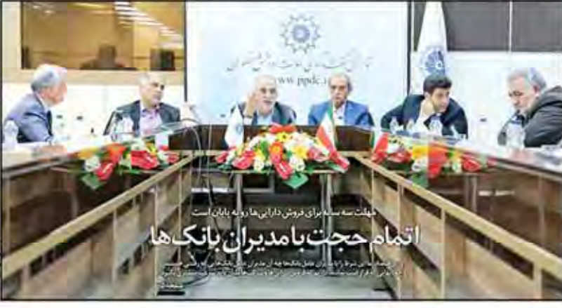
تمام حجت با مدیران بانک ها

تولید اقتصادی، سرمایه گذاری، اشتغال و رفاه اجتماعی از شاخص های اصلی اقتصاد هستند. در این نشست، چهار شاخص عقلانیت در تصمیم گیری های رسمی بررسی شد.