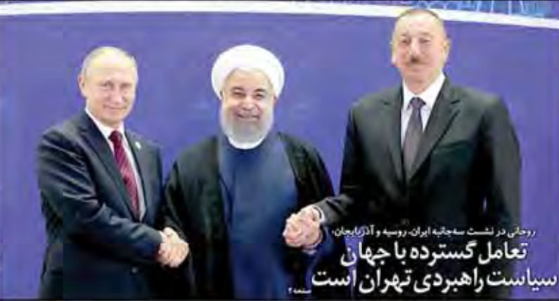
روحانی در نشست سه جانبه ایران، روسیه و آذربایجان، تعامل گسترده با جهان سیاست راهبردی تهران است

دولت اقتصاد به سرعت پایین می آید اصلاح اقتصاد به سرعت پایین می آید اصلاح اقتصاد به سرعت پایین می آید