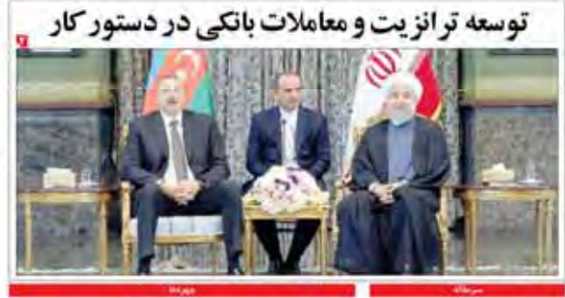
توسعه ترانزیت و معاملات بانکی در دستور کار

یک درمزد مالیات آلودگی پیش نویس نقشه راه صنایع معدنی ارائه شد ایجاد تشنج است آمریکا بهمدنیا