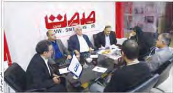
میزگرد تخصصی فله‌سازان در نمايشگاه مطبوعات صنعت قطعه را ببینید و سخن آن را بشنوید

بنای کار اساسی پیمان پولی آسیا-اقیانوس غربی و آسیا-اقیانوس شرقی در تهران برگزار شد. در این مراسم، رهبر انقلاب اسلامی، رئیس‌جمهور ایران، نخست‌وزیر ترکیه و نخست‌وزیر استرالیا حضور داشتند. همچنین، وزیر امور خارجه ایران، وزیر امور خارجه ترکیه و وزیر امور خارجه استرالیا نیز در این مراسم شرکت کردند.