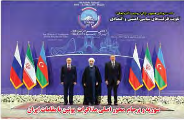
سوریه و برجام محور اصلی مذاکرات بوتین با مقامات ایران

پیش بینی عدم توافق در نشست تاویل سیزدهم دلار کوتاه نمی آید