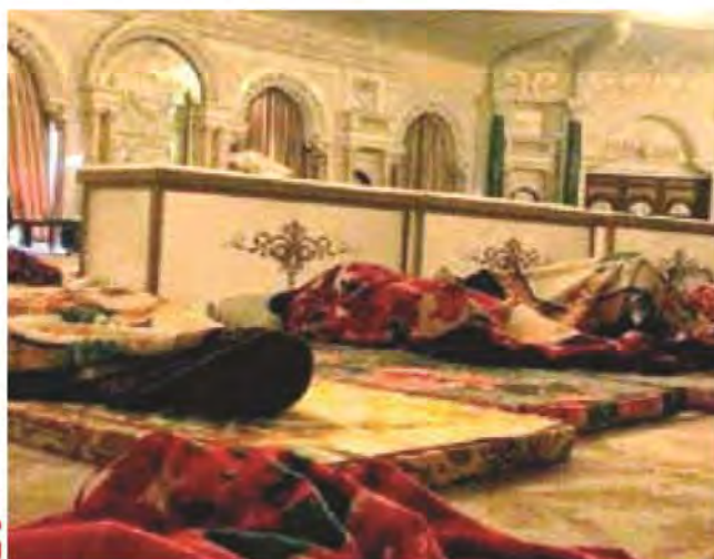
باشگاه خبرنگاران جوان

اولین تصاویر از بازداشتی‌ها در عربستان منتشر شد