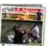
توسعه چابهار شتاب گرفت

شوق و شکوه در مسیر عشق از مرز کربلا و نجف معاون و همکاران حسینی از کربلا و نجف