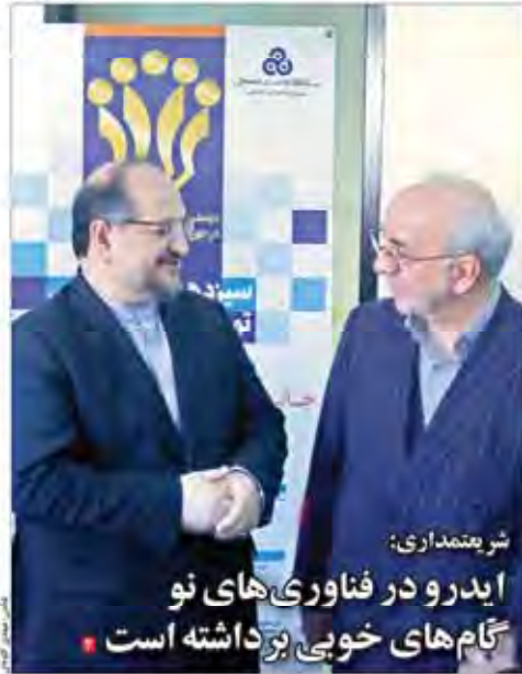
شریتمنداری: ایدرو در فناوری‌های نو گام‌های خوبی برداشته است

اصلاح ساختار در جهت بزرگ شدن دولت نبود. این اقدامات بیشتر به منظور بهبود کارایی و کاهش هزینه‌ها انجام شده است. مدیران دولتی باید به دنبال راهکارهای نوینی برای بهینه‌سازی فرآیندهای اداری و خدماتی خود باشند.