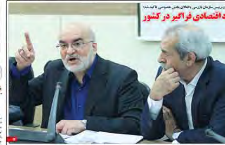
فردرشت، رئیس سازمان بازرسی با فعالان بخش خصوصی لایحه شد

فردرشت، رئیس سازمان بازرسی با فعالان بخش خصوصی لایحه شد. این اقدامات به منظور بهبود فرآیندهای اداری و خدماتی انجام شده است.