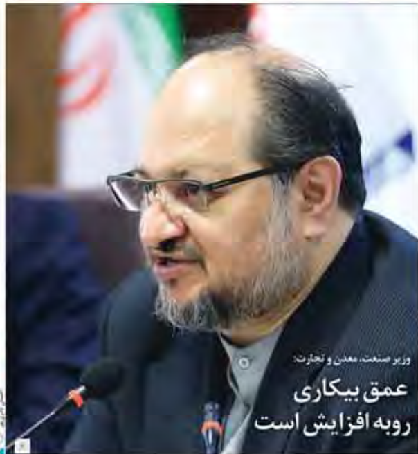
وزیر صنعت، معدن و تجارت: عمق بیکاری روبه افزایش است