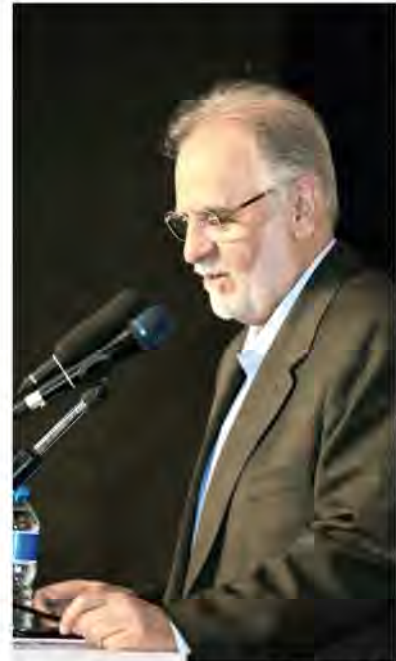
It possesses 7 percent of the world's total mineral reserves worth about $700 billion.

Iran is one of the top 10 mineral-rich countries where 68 types of minerals have been identified so far, including the world's largest deposits of copper, zinc and iron ore, which are tempting international investors after the lifting of Western sanctions in January 2016.