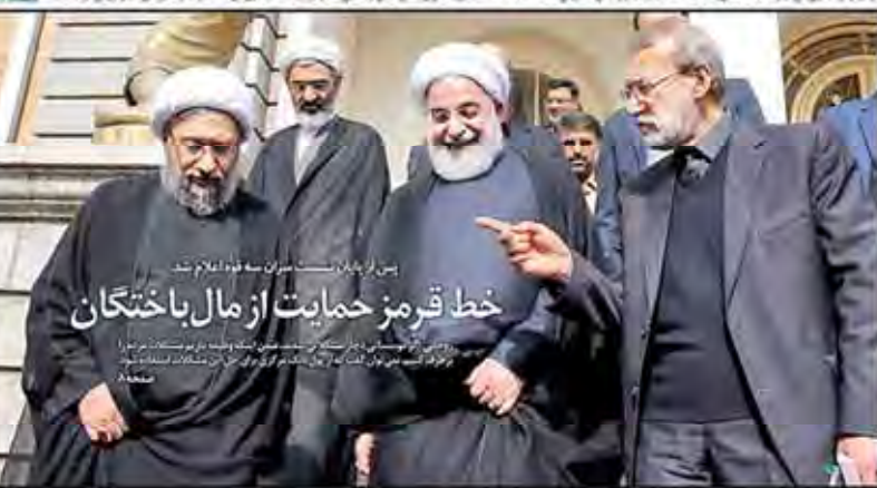
پس از پایان نشست سران سه فولاد اسلام آباد، خط قرمز حمایت از مال باختگان

صندوق توسعه ملی در راستای تسهیل فرآیند جذب سرمایه‌های خارجی و افزایش سرمایه‌های داخلی، اقدام به انتشار عمومی ۵۹ میلیارد دلاری صندوق توسعه ملی کرده است. این اقدام در راستای سیاست‌های کلی اقتصاد مقاومتی و تحقق اهداف برنامه پنج‌ساله توسعه است.