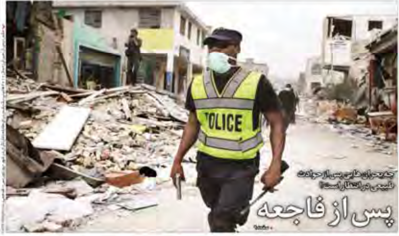
پس از فاجعه تأسیسات زیرساختی را بررسی می کنند

رئیس جمهوری جزئیات نشست روسای سه قوه، یافته ها و قضاوت درباره مشکلات موسسه های مالی و اعتباری و مطالبات خانگان را تشریح کرد