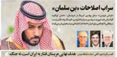
سراب اصلاحات «بن سلمان» پس از فریب سفر به چین آمریکا در هیئت مدیره گفته‌های مدیرعاملی در تهران نشان داد که این هیئت مدیره بر تعالی اقتصادی بر رویان اصلاحات اقتصادی در کشور بر سر می‌گذارد

ایران و فرانسه با تصمیم هیئت مدیره شرکتی کشاورزی ایجاد می‌کنند استانبول کشور ترکیه با راه‌اندازی کارخانه اروپا فرغ از تولید ایران یک‌بارگی به خاطر کمبود محصولات