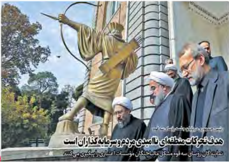
بسیجی در جریان جشنواره سوره کلام هدف تحرکات منطقه‌ای نامیدی مردم و سرمایه‌گذاران است شماره‌نگاران رؤسای سه قوه مشکل مالیات‌خیزان مؤسسات اعتباری را پیگیری می‌کنند

سال بنیاد و سوم شماره ۱۱۶۴ یکشنبه ۲۱ آبان ۱۳۹۶ ۲۳ مهر ۱۳۹۶ ۲۶ صفحه مبارک استانبول ۳۰۰ تومان استان تهران و البرز ۵۰۰ تومان Sunday ۱۲ Nov 2017 No. 6647