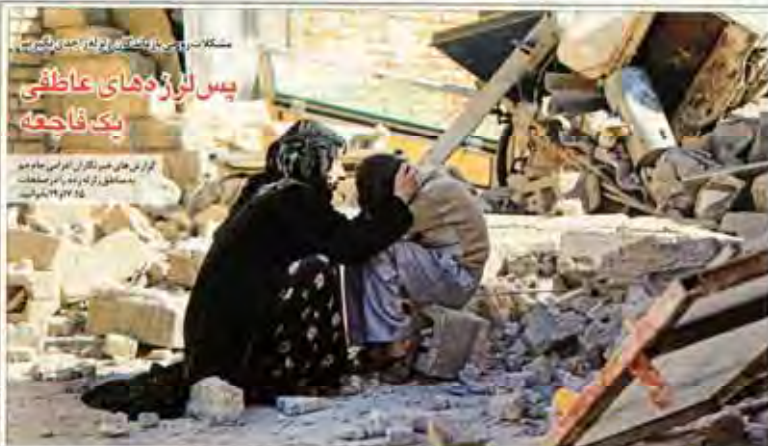
مشکل سرپرستی و نگهداری از کودکان در مناطق آسیب دیده زلزله