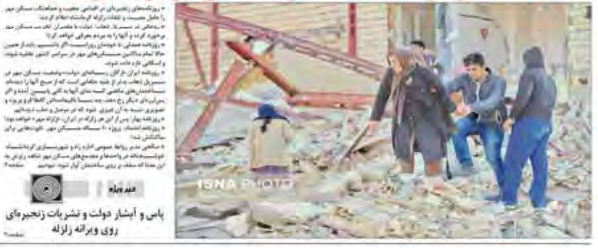
پاس و ایشار دولت و تشریحات زنجیرهای روی ویرانه زلزله

علی رغم تب و تاب ملی برای کمک به زلزله زدگان آوار دروغ سنگین تر از آوار مصیبت جهانگیری: بیشترین تخریب متعلق به مسکن مهر است اداره مسکن کرمانشاه: تنها ۲ نفر در مسکن مهر فوت کرده‌اند