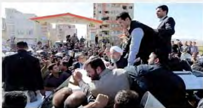
به خواسته اصلی زلزله‌زدگان از روحانی: