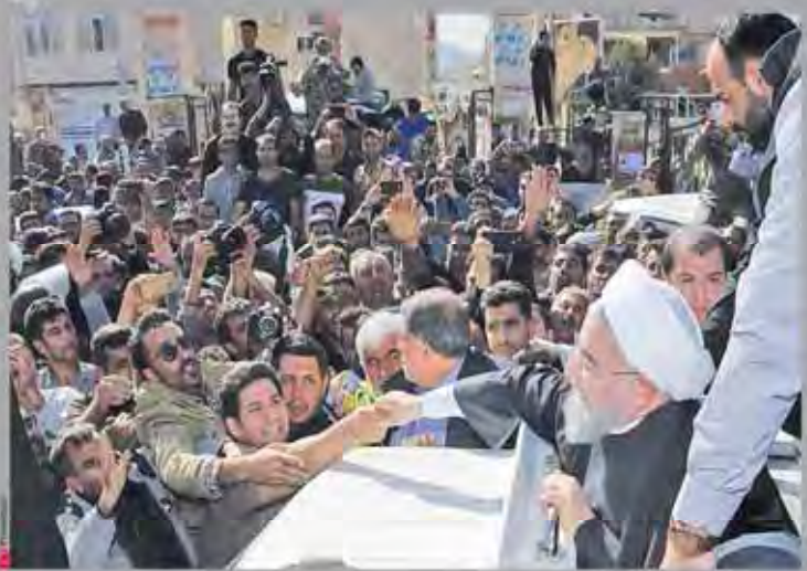
رئیس جمهوری در کمپین همیاری ملی برای کمک به زلزله زدگان در عرصه عمل و کمک با قوت ادامه یابد

دولت با همه توان خود برای آسودگی زلزله زدگان و کمک به بازسازی و توسعه دولت در عرصه عمل و کمک با قوت ادامه یابد