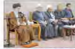
تأکید رهبر انقلاب بر تسريع اعمار زلزله زدگان در نشست با سران قوه

نظامیان آمریکایی چگونه صدها داعشی را از رقه فراری دادند؟