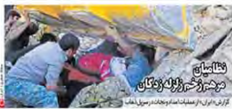
گزارش «دولت» از عملیات امداد و نجات در زمین لرزه زنگان

مردم! نهاییان تکذارید ۲۸۵ خانمان بر انداز