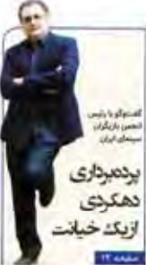
پدیده‌های دهکده زنگ خبیث