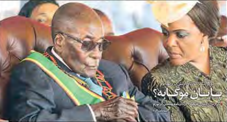
رئیس‌جمهور در دیدار با رئیس‌جمهوری کوبا

رئیس‌جمهور از علائم فساد در ساخت‌وسازهای دولتی خبر داد