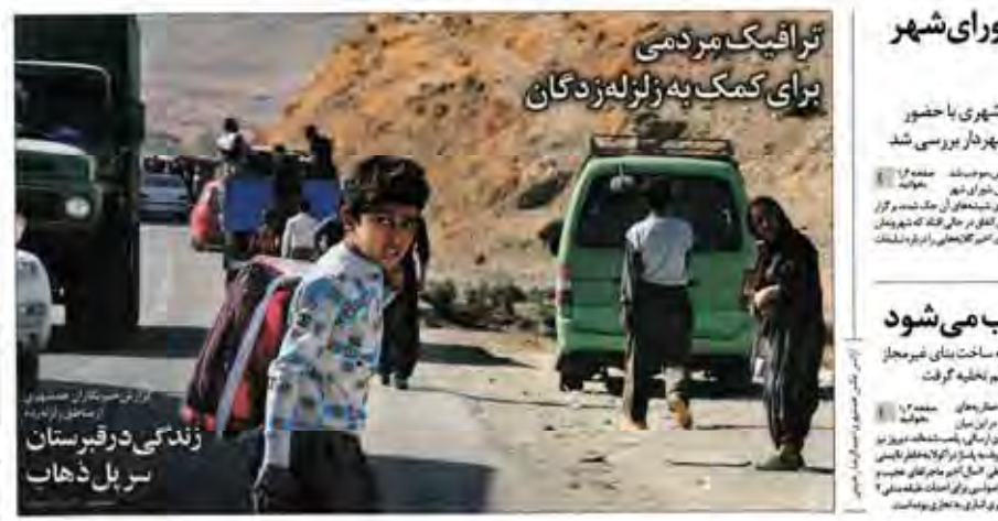
ترافیک مردمی برای کمک به زلزله زدگان

با دستور رئیس جمهور، بنیاد مسکن متولی بازسازی واحدهای مسکونی آسیب دیده در زلزله کرمانشاه شد و دیگر دستگاه ها از مازی کاری منع شدند بر اساس مصوبات هیات دولت ۶۵۹ میلیارد تومان تسهیلات و ۲۸۱ میلیارد تومان کمک بلاعوض به زلزله زدگان پرداخت می شود