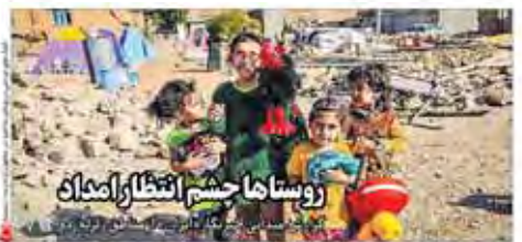
روستاهای چشم انتظار آمدن

در این خبر خیران قوا بعد از بحث و تبادل نظر با هیات دولت، تسهیلات و کمک های بلاعوض ۹۴۰ میلیارد تومانی برای زلزله زدگان در استان های آذربایجان شرقی، آذربایجان غربی، اردبیل، گیلان و مازندران، که در این استان ها خسارت های زیادی به وقوع پیوسته است، تصویب شده است. تسهیلات و کمک های بلاعوض ۹۴۰ میلیارد تومانی برای زلزله زدگان در استان های آذربایجان شرقی، آذربایجان غربی، اردبیل، گیلان و مازندران، که در این استان ها خسارت های زیادی به وقوع پیوسته است، تصویب شده است.