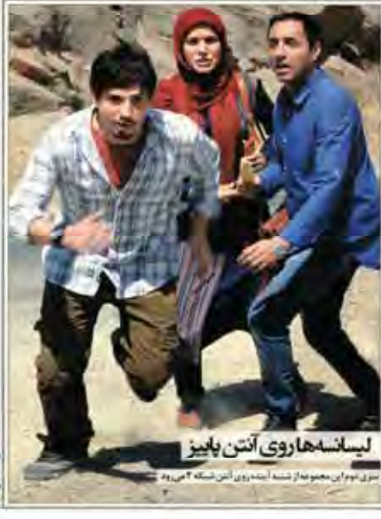
لیسانه‌ها روی آنتن پاییز سری دوم این مجموعه از شبکه ۲ می‌آید