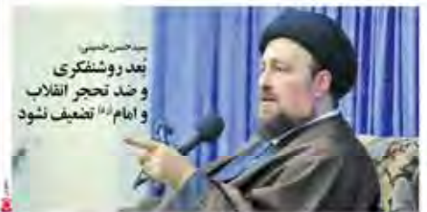
بعد روشنگری و حجاب تجر انقلاب و ایام از تضعیف نشود

عربستان سعودی را عوض کند تا در صلح منطقه شریک شود