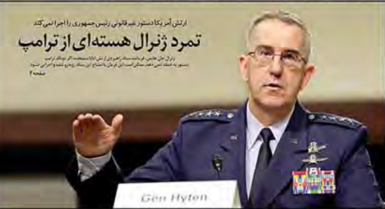
ارتش آمریکا دستور خبر فتوی رئیس جمهوری را اجرا نمی کند

مقایسه عملکرد بانک مرکزی در سال گذشته با عملکرد بانکهای دیگر در بازارهای مالی