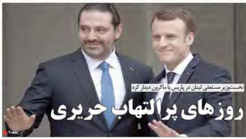
نخست‌وزیر مستعفی لبنان در پاریس با ماکرون دیدار کرد

سرمایه‌داری رژیم فرانسه فرصت طلایی را از دست می‌دهد