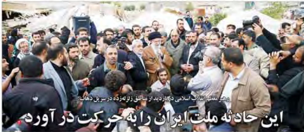
این حادثه ملت ایران را به حرکت در آورد

بدهی ۳۰ هزار میلیارد تومان مربوط به خود دولت است و حدود ۲۰ هزار میلیارد تومان به شرکت‌های دولتی و وابسته است.