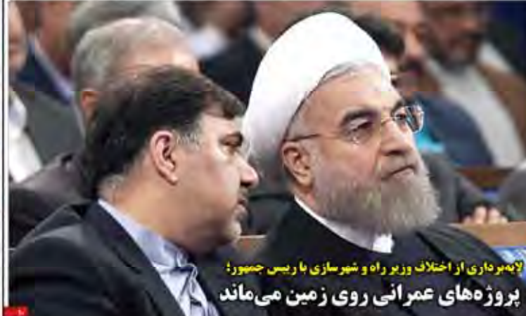
پروژه‌های عمرانی روی زمین می‌ماند

گروه اقتصادی - از نظر اقتصادی و بودجه‌ای، دولت در سال ۱۳۹۶ با برداشت ۱۶ هزار میلیارد تومان از خزانه، به موازات اجرای طرح‌های عمرانی و توسعه‌ای، در مسیر تحقق اهداف خود قرار دارد.