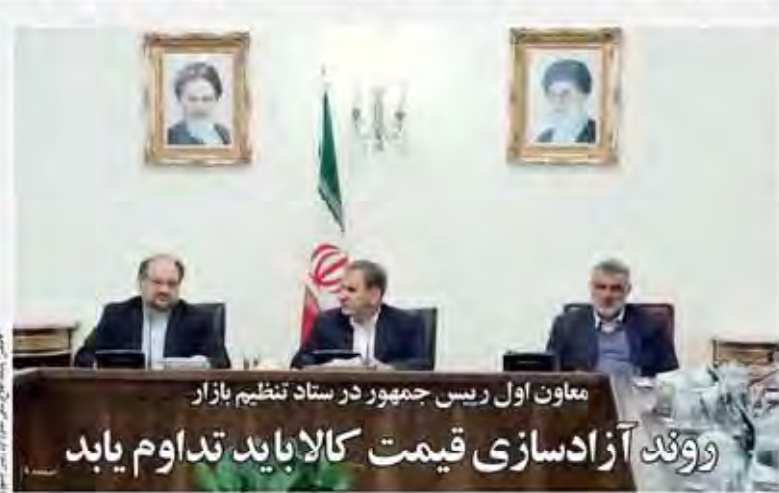
معاون اول رئیس جمهور در ستاد تنظیم بازار روند آزادسازی قیمت کالا باید تداوم یابد