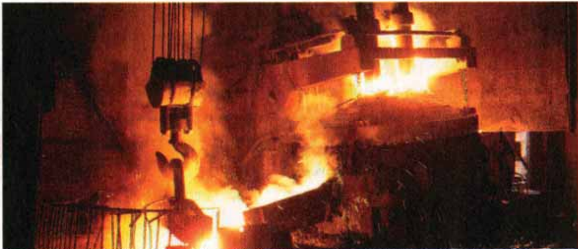
The world's 66 steelmakers produced 1.41 billion tons of steel during the 10 months, up

China remained the world's largest producer in the 10-month period with 709.5 million tons of steel output. Chinese steel production hit 72.36 million tons in October, registering a 6.1% increase YOY. The giant steelmaker has been growing in output every month, and it has now increased output over its September output.