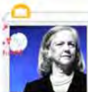
مدیر عامل HP